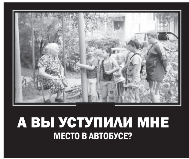
А ВЫ УСТУПИЛИ МНЕ МЕСТО В АВТОБУСЕ?