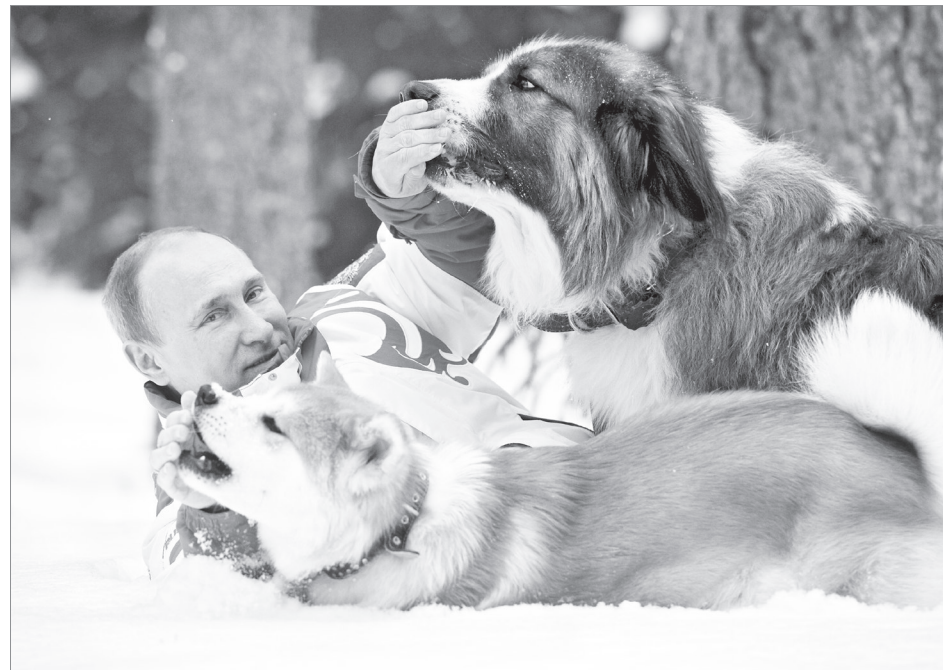
Для того, чтобы президент рассмотрел петицию о введении должности Уполномоченного по защите животных, нужно собрать 100 тысяч подписей

Во многих городах и различных населенных пунктах, безусловно, есть люди, безразличные к жизням и судьбам животных, и они пожелают отдать свой голос за введение должности уполномоченного. Но проблема в том, что СМИ чаще всего не освещают такого рода проекты, и многие граждане попросту не осведомлены об их существовании. Жители Сысерти теперь знают об одном из них. В редакции «Сысертской недели» до конца недели находятся бланки для заполнения данных голосующих. В начале мая они будут переданы в Москву. Мы приглашаем всех читателей, желающих помочь животным – бездомным, домашним, диким, уделить немного времени, по-