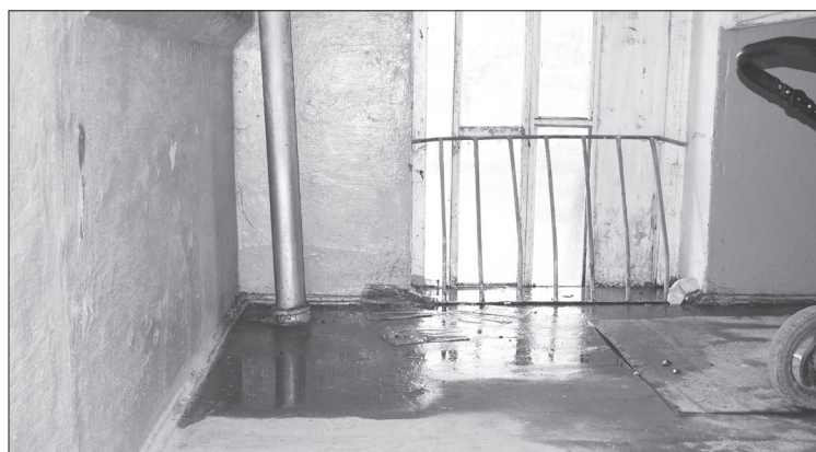
Фото от 23 апреля

Жильцы 5-го подьезда дома по улице Орджоникидзе, 31».