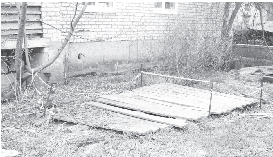
По этим доскам огромная дыра в нечистоты

Ранее мы писали о семидневных выходных, которые ждут нас в мае.