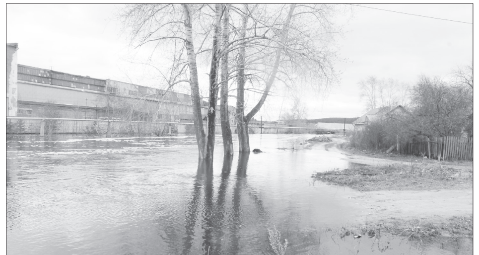
Топля, которые росли на берегу, сейчас оказались посреди водоема