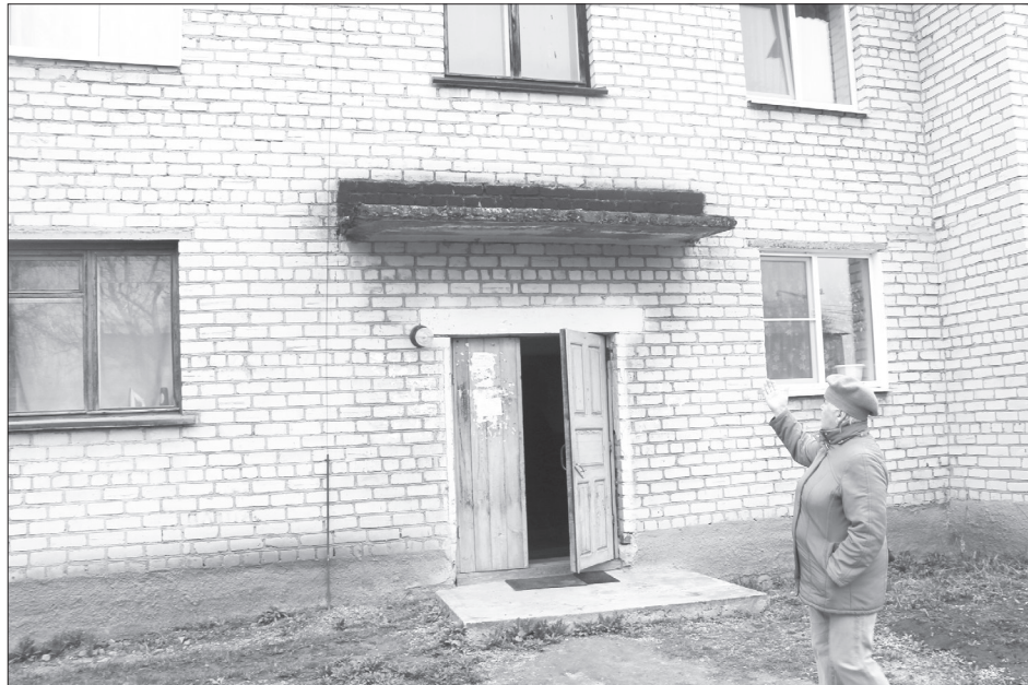
В доме №7 по улице Гагарина считают, что им специально испортили козырьки над подъездами

Особое недовольство людей вызывает график вывоза жидких бытовых