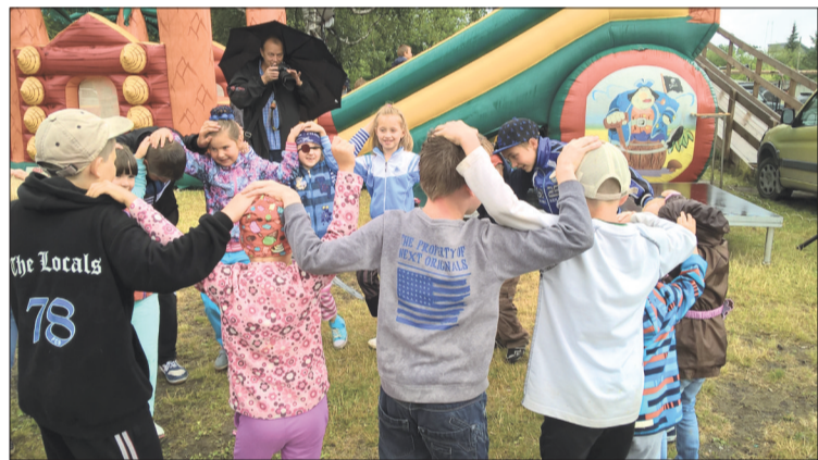
Юные двуреченцы, будущие работники КЗФ, уже сейчас действуют слаженно