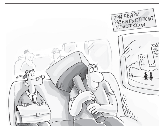
Рисунок Николая Крутикова

А интересно всё-таки: где же эти аварийные молотки? Что-то не видно их в автобусах. Чем бить будем, граждане?!