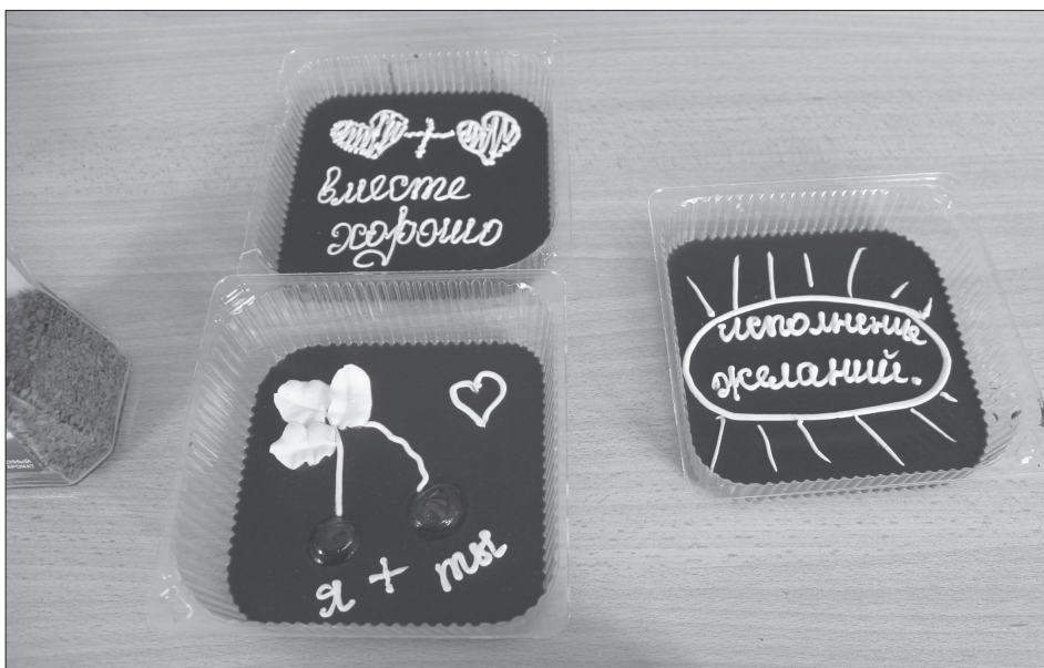
Торты на разные случаи жизни будет выпускать «Сысертский хлебокомбинат»

В канун международного дня торта «Сысертский хлебокомбинат» разрабатывает новую сладкую продукцию.