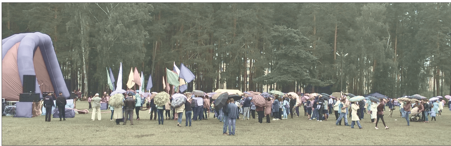
Праздник с зонтиками