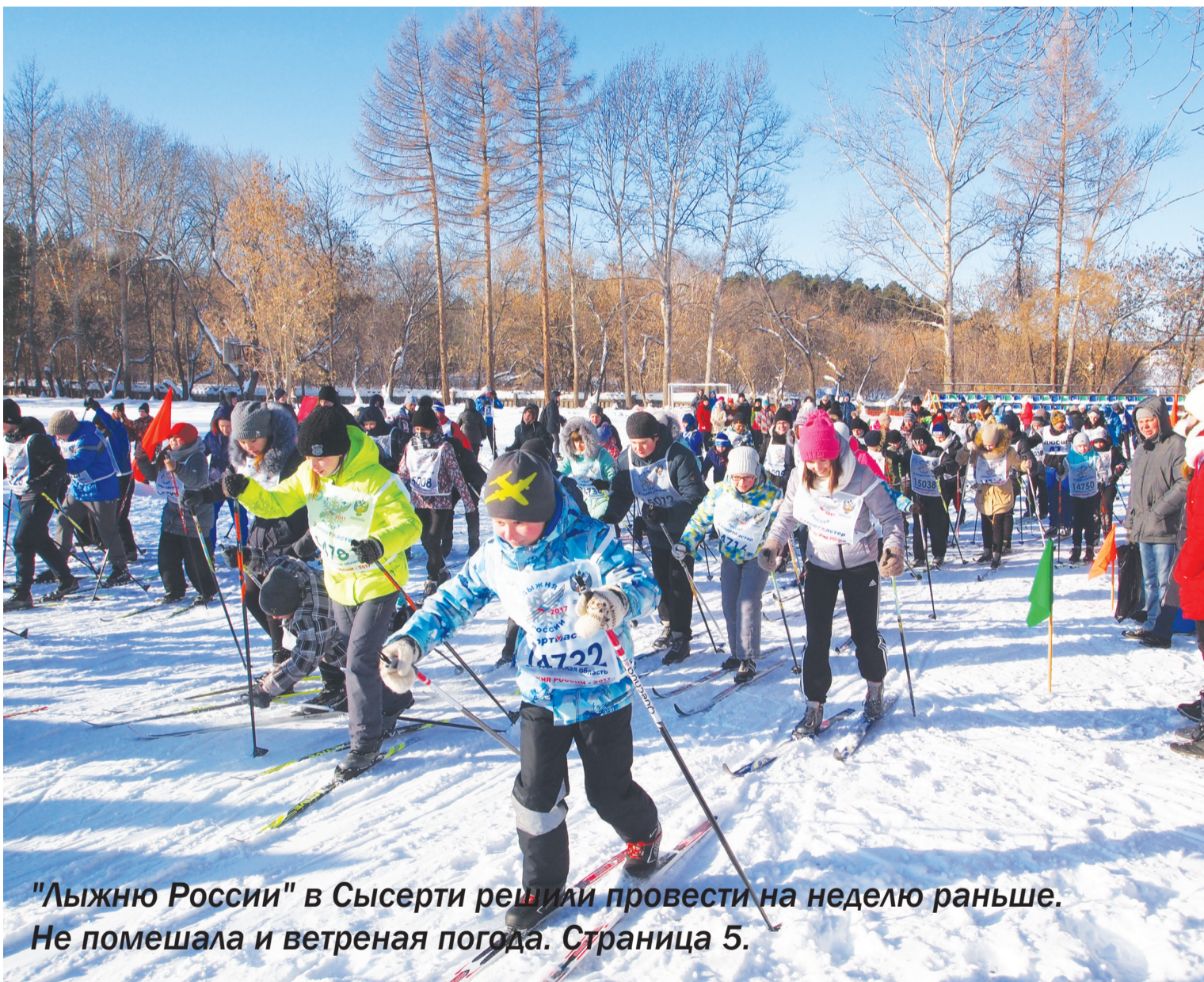
"Лыжню России" в Сысерти решили провести на неделю раньше. Не помешала и ветреная погода. Страница 5.