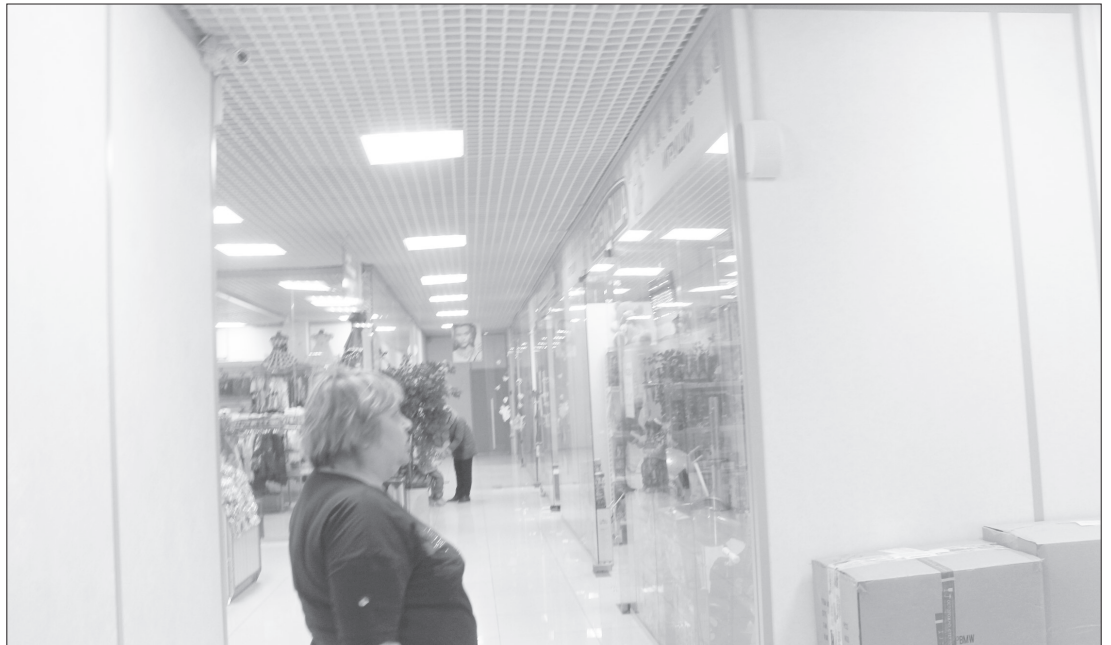
Пожарный оповещатель - первое, что проверяют сотрудники МЧС

Информация Южного Екатеринбургского отдела Управления Роспотребнадзора по Свердловской области