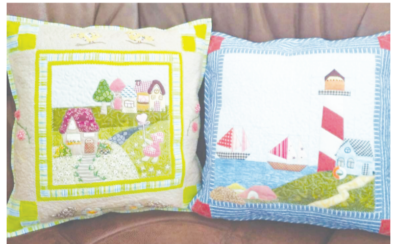
Кораблики и домики - тоже красиво!