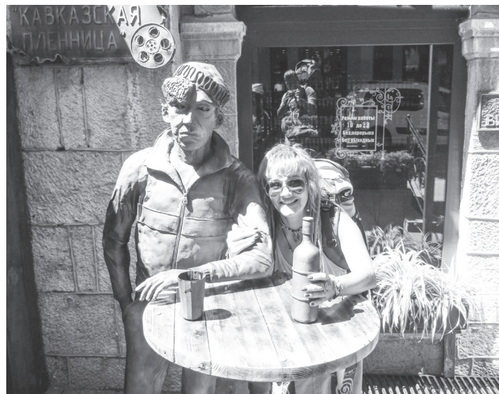
"Выпить" с Никулиным

После прогулки по набережной, изобилующей людьми в плавательных костюмах с надувными матрацами, кафе, сувенирными лавками, аттракционами и прочими увеселительными заведениями посчитали необходимым уединиться от городской суеты на природе. «Выпив» на посешок с Юрием Никулиным (эпизод художественного фильма Аркадия Гайдая «Кавказская пленница» снимали в доме, где установлен монумент герою фильма),