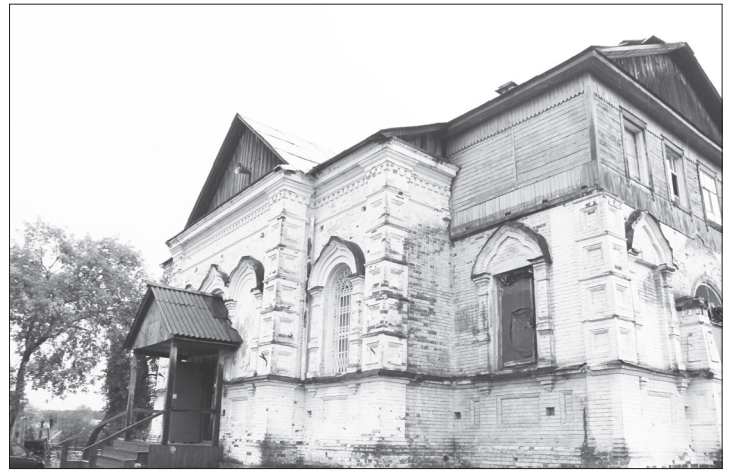
Храм Успения Пресвятой Богородицы в Верхней Сысерти

- Нет, люди к нам идут. В Храм Преображения Господня (маленький бревенчатый Храм рядом – ред.) приходят в праздники до 100 человек. Есть колокольный звон. Когда мы начнем