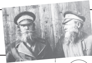
5 сентября 1698 года Петр I установил налог на бороды, чтобы привить своим поданным моду, принятую в других европейских странах