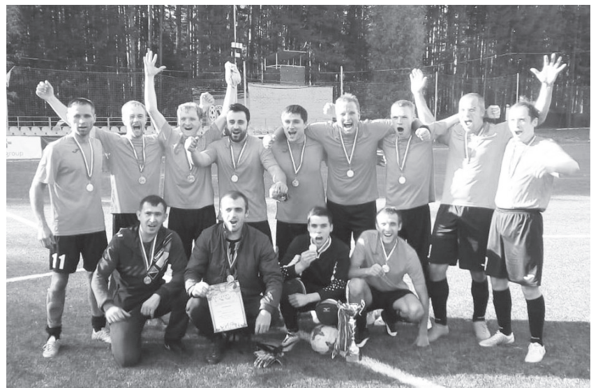
Обладатели Кубка Сысертского округа по футболу - команда «Сысерть»