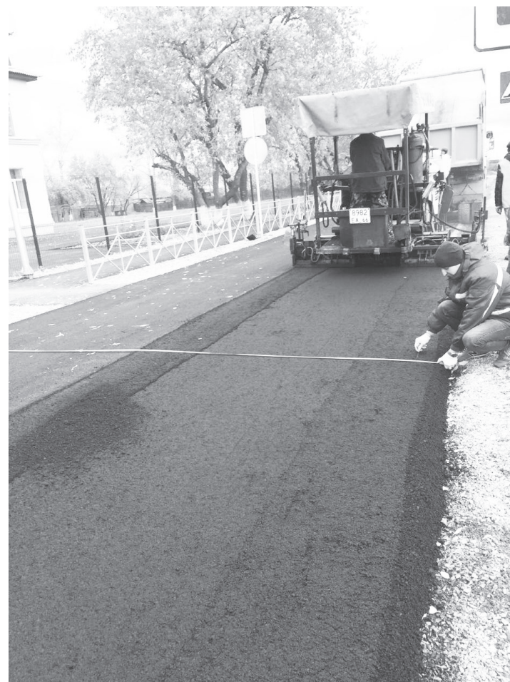
Ремонт дороги в Щелкуне

В 2018 году приобретено 27 светодиодных светодорожек. Они установлены на пешеходных переходах. Моргают одним желтым глазом.