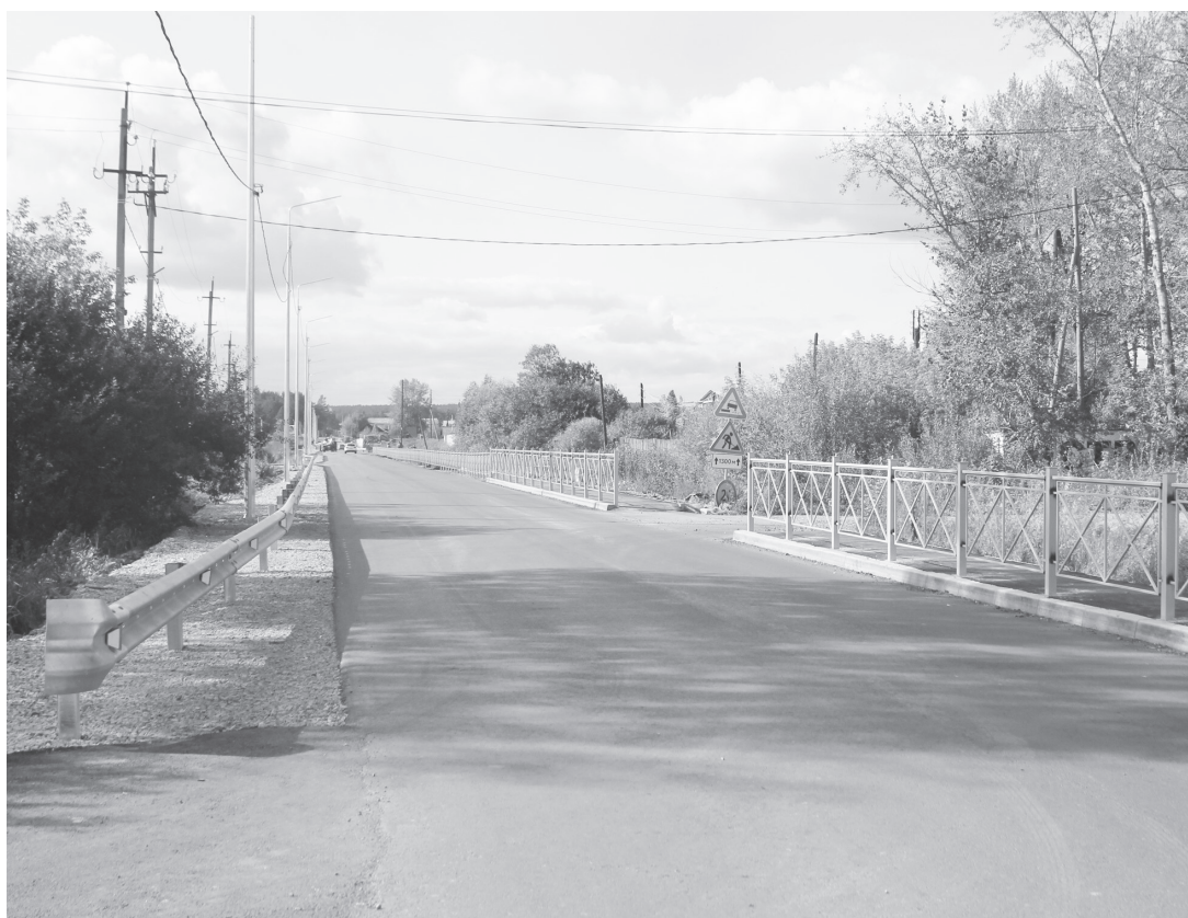
Самая дорогая из отремонтированных улиц - Самстроа. Стоимость ремонта - 47 миллионов рублей.

улицы Ленина, в Кадниково провели ямочный ремонт улицы Карла Маркса, в Кашино также ямочный ремонт улицы Новая.