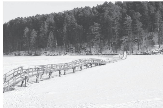
Мост в поселок Луч каждый год по весне демонстрирует чудеса стойкости

Оба садика – на 270 мест, три наземных этажа, площадь каждого здания 3800-3900 квадратных метров. В каждом садике будет по одной ясельной группе (20 детей 1-2 лет), по 3 младших группы (25 детей в каждой), по 3 средних группы (по 25 человек каждой), по 2 старших и подготовительных группы (по 25 детей). Деньги на проектирование будут выделены из бюджета муниципалитета.