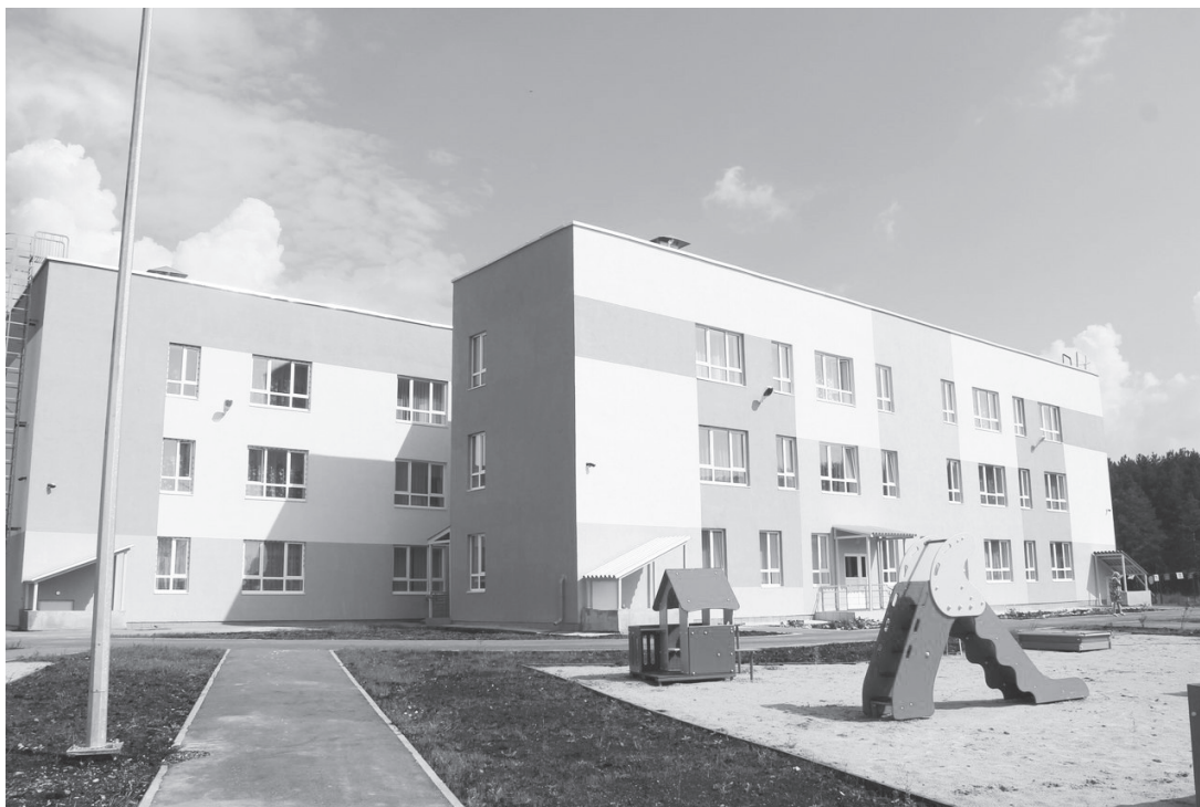
Трехэтажный детский сад на 270 мест в поселке Большой Исток

Также известно, что ставится задача спроектировать котельные полностью автоматическими, то есть никакого персонала внутри не будет. Аварийная сигнализация будет выведена на пульт дежурного диспетчера МУП ЖКХ «Сысертское».