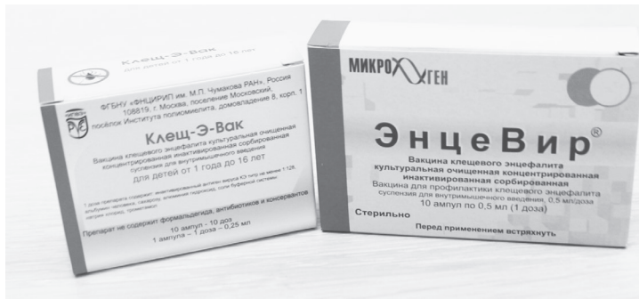
Стоимость вакцины колеблется от 550 до 650 рублей.

Необходимо взять с собой полис ОМС, в регистратуре взять большой талон, приобрести бахилы, получить