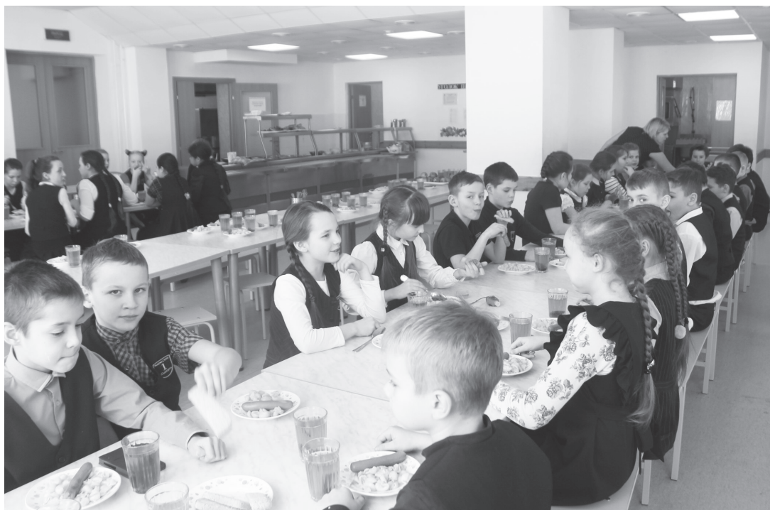
Ребята из школы №1 хвалят своих поваров, говорят, что еда всегда вкусная.

Новый СанПин окончательно закрепит норму, запре-