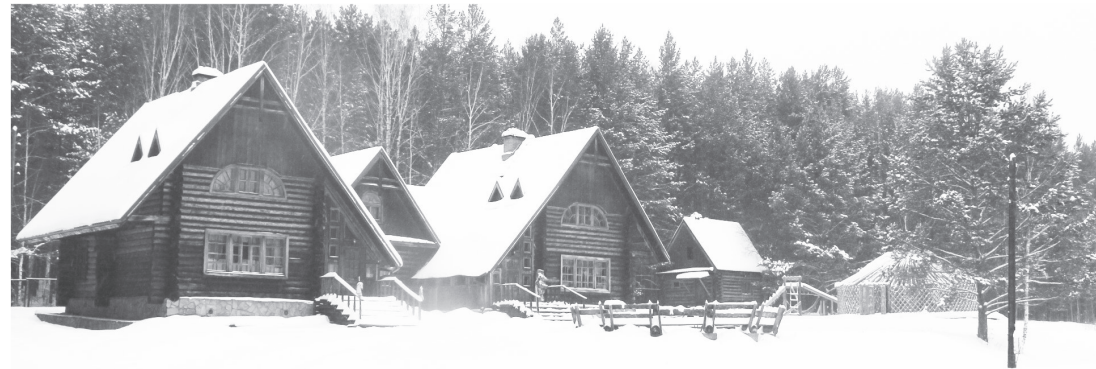
Территория клуба - домики и беседка.

ль Овчинникова. - Люди зашли в свои квартиры, дворах. Надо, чтобы они выходили, расширяли границы своего сознания. Мы хотим поделиться нашими возможностями, рассказывать о том, что мы тут есть, показывать наших лошадей. Мы пытаемся сделать наши занятия доступными.