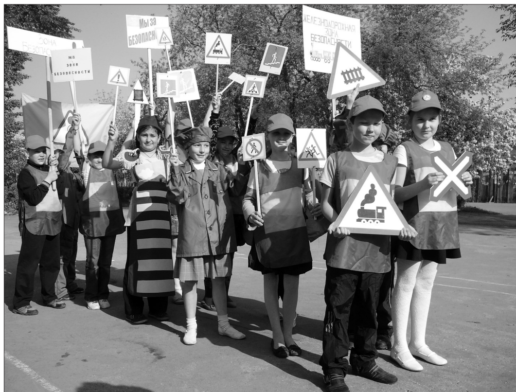
Воспитанники отряда «Юный пешеход» вышли на улицы города с плакатами и дорожными знаками.

Под таким названием завершился месячник дорожной безопасности, проходивший в детском центре «Мир».