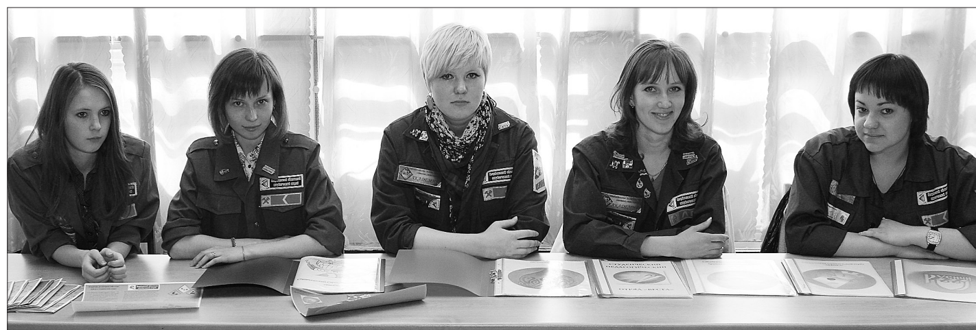
* Участники ярмарки-презентации - представители студенческих отрядов.

низации музея лица №51. В этом году образовательным учреждением исполнителю 20 лет, подарком станет современный выставочный комплекс на базе двух суще-