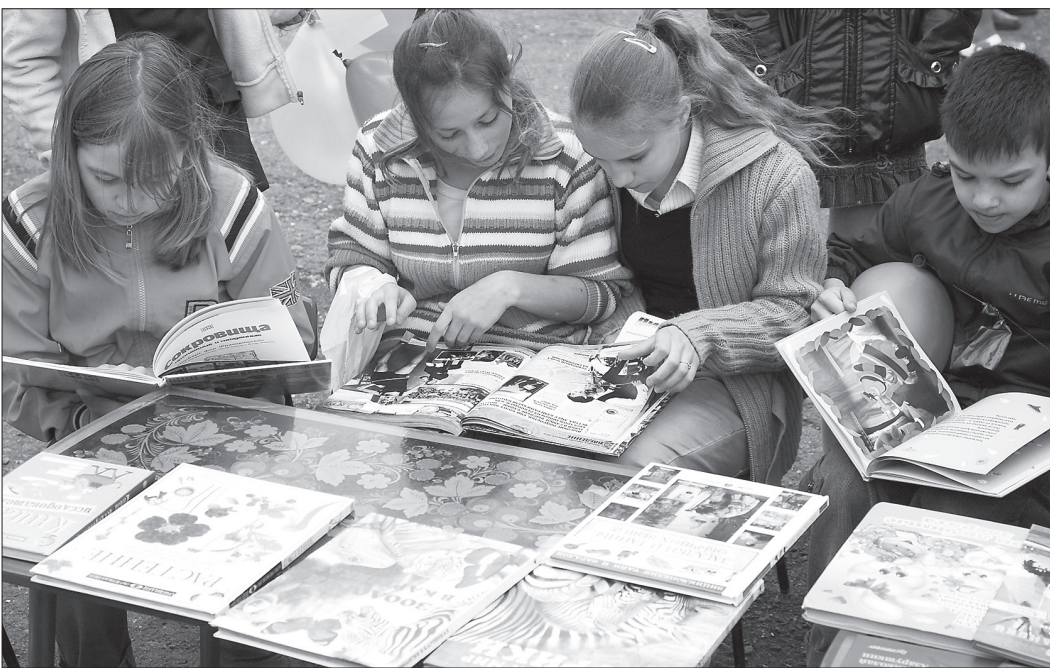
* Читальный зал под открытым небом.

Несмотря на хмурое небо, настроение у ребят было радостное и они с удовольствием приняли участие в литературных викторинах и веселых стартах, организованных сотрудниками цент-