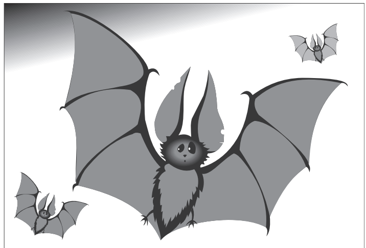
Иллюстрация Петра УПОРОВА.

Английскую церковь Святой Хильды в Северном Йоркшире, построенную в XI веке, заселила колония летучих мышей.