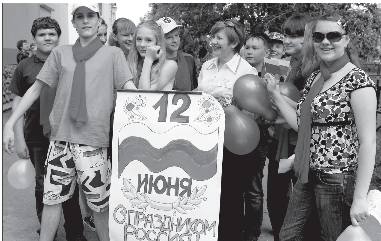
Участники деловой игры «Государственные символы России»

В преддверии Дня России Тагилстроевская районная территориальная избирательная комиссия провела деловую игру «Государственные символы России».