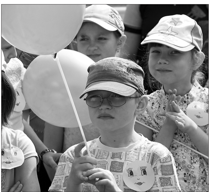
* Юные участники праздника.