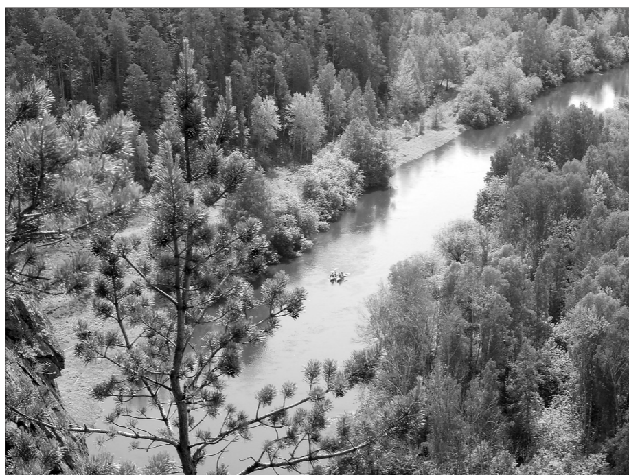
* Вид с вершины Медведь-Камня. Внизу – команда участников на катамаране.