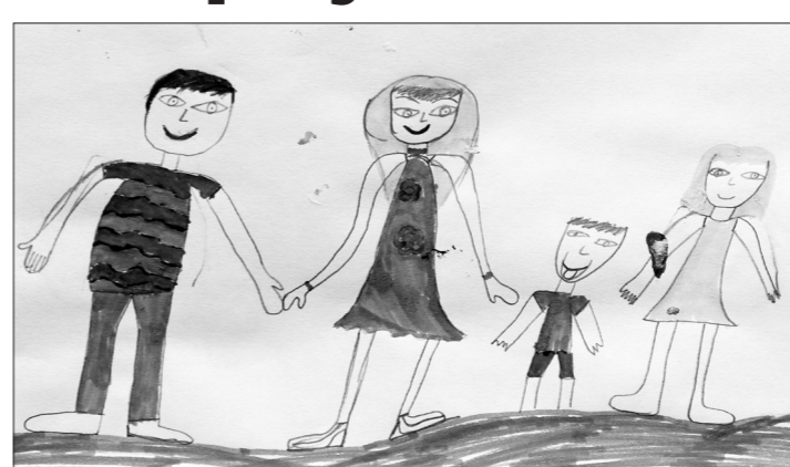
* Рисунок Насти Жолобовой, ученицы 2-го класса школы №36.

Весь июнь в филиале №6 центральной городской библиотеки проходит выставка детских рисунков.