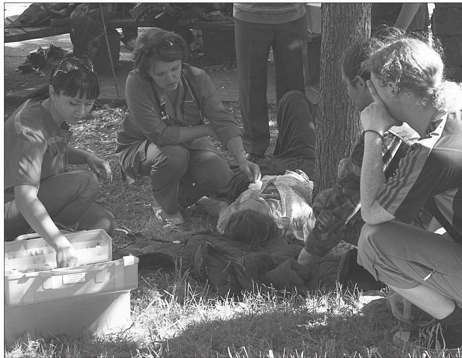
Первая помощь пострадавшему на поле брани.