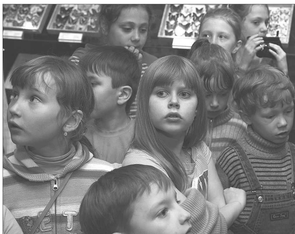
* Ребятам интересно.