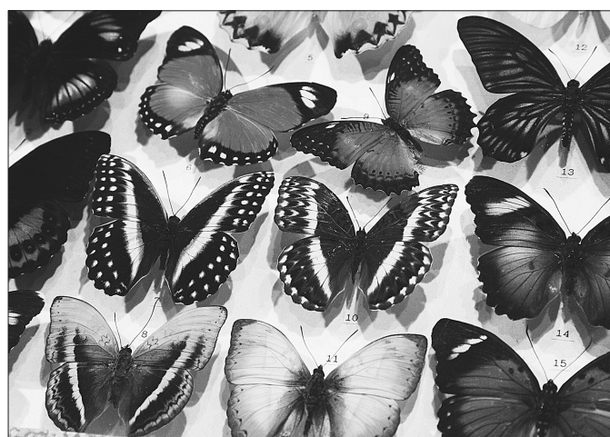
* Тропические бабочки.