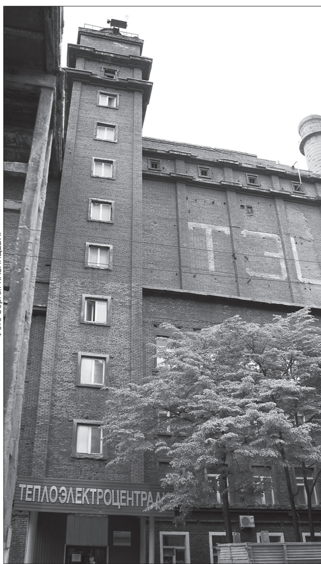
* Теплоэлектроцентраль НТМК.