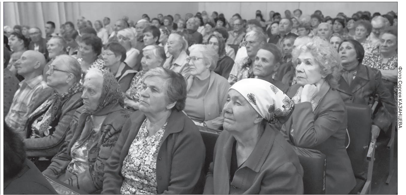
* Жители поселка возлагают на встречу с главой большие надежды.