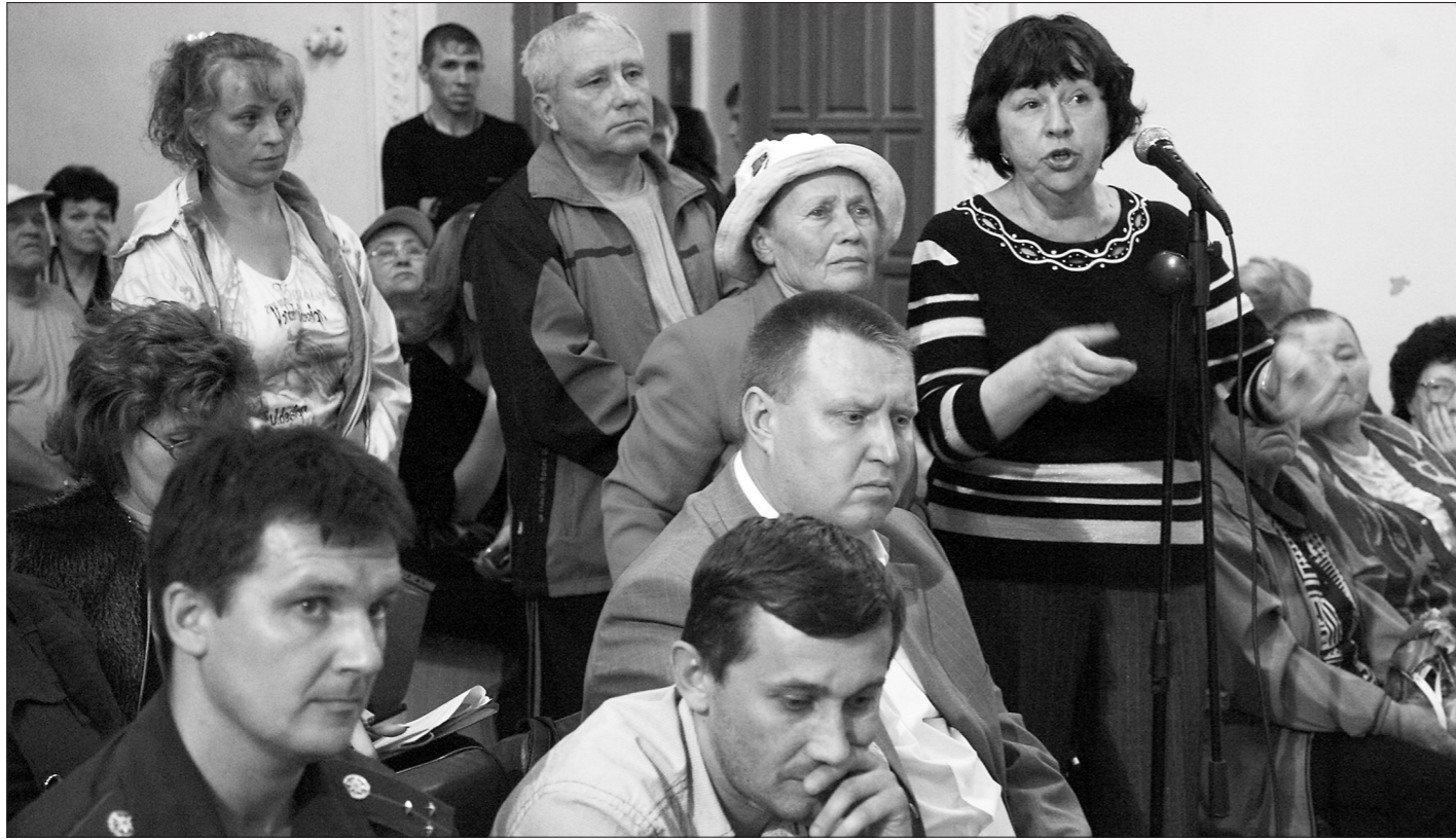
* К микрофону выстроилась очередь, когда приступили к обсуждению проблем ЖКХ.