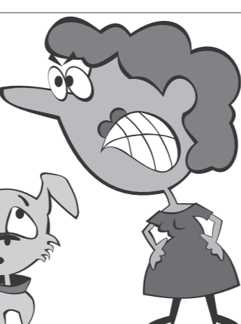
Иллюстрация Петра УПОРОВА.

сенный им моральный ущерб от разлуки с двухгодовалым псом в 11 миллионов долларов. Решение по иску об опекунстве