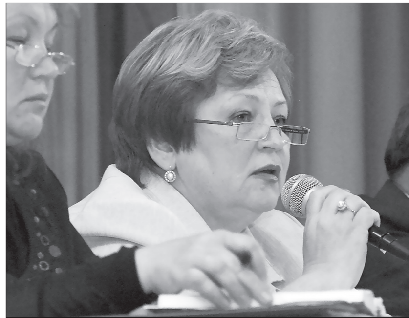
* Глава города отвечает на вопросы жителей Рудника.