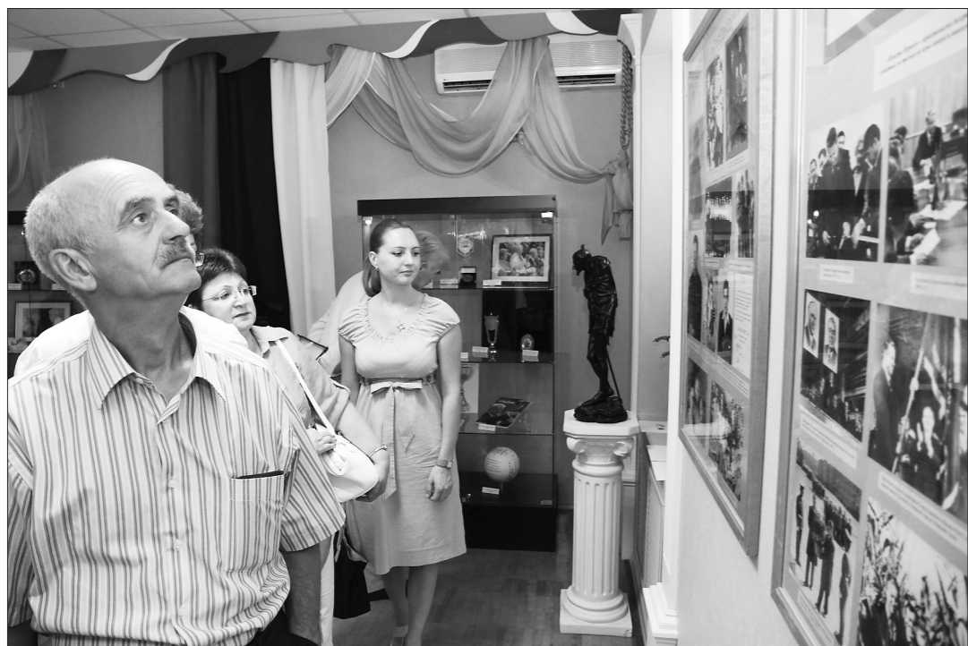
В музейно-выставочном центре НТМК открылась выставка, посвященная 80-летию первого президента России Бориса Ельцина и 20-летию со дня избрания его главой государства.