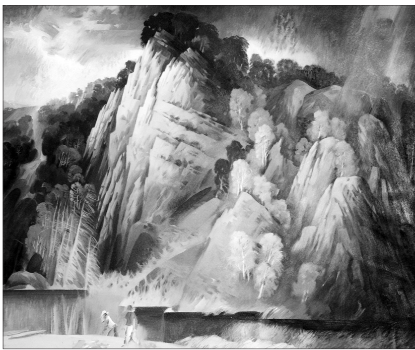
* Леонид Ваврженчик. «Вечерние грозы».