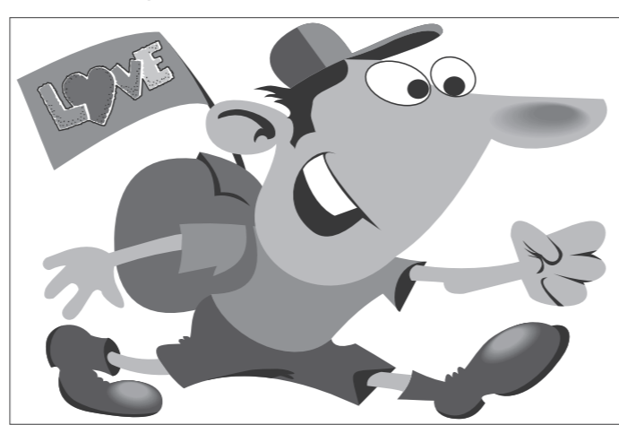
Иллюстрация Петра УЛЮРОВА.

Китаец Лю Пэйвэнь пройдет пешую дистанцию в тысячу миль (более 1600 километров) ради того, чтобы жениться на любимой девушке.