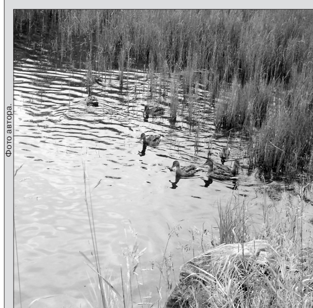
* Место происшествия: ничто не напоминает о трагедии.