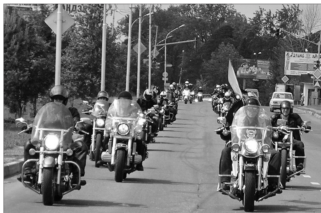
* Фото с официального сайта клуба.