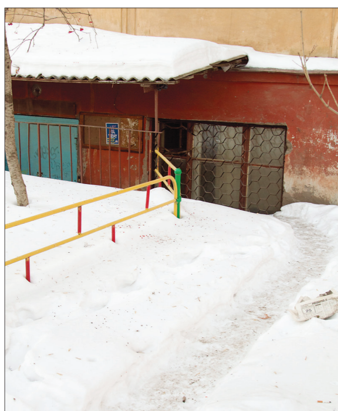
* Встречи проходят по адресу: улица Пархоменко, 38.