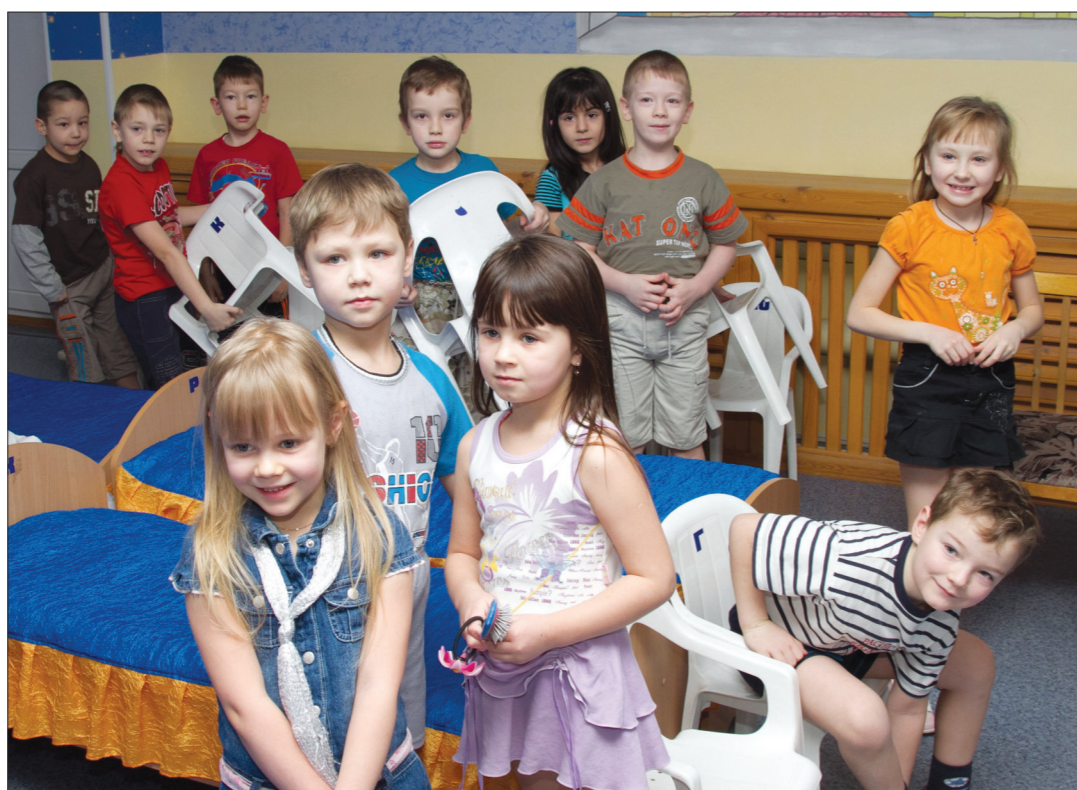
* В спальнях после ремонта стало уютно.

В этом году «Маячок» отмечает 20-летие. Дата совпала с переходом из-под опеки УВЗ в ведение муниципалитета. Смена статуса, по словам педагогов, не принесла дополнительных стрессов, как и увеличение количества воспитанников. Наобо-