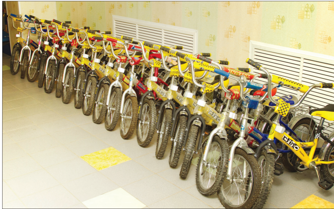
* Новые велосипеды появились в учреждении благодаря программе развития сети детсадов.