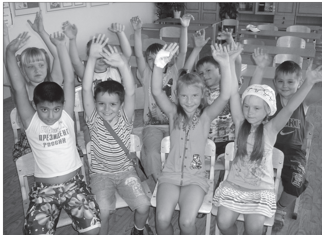
* Ученики школы №20: «Нам здесь нравится!»

Вчера у учеников школы №20 на Вагонке завершилась вторая смена в лагере дневного пребывания. Чтобы разнообразить детский досуг, воспитатели старались как можно чаще посещать с ребятами музеи, кино, развлекательные площадки города.