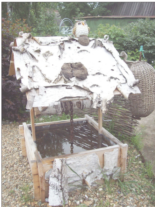
* Берестяной колодец.