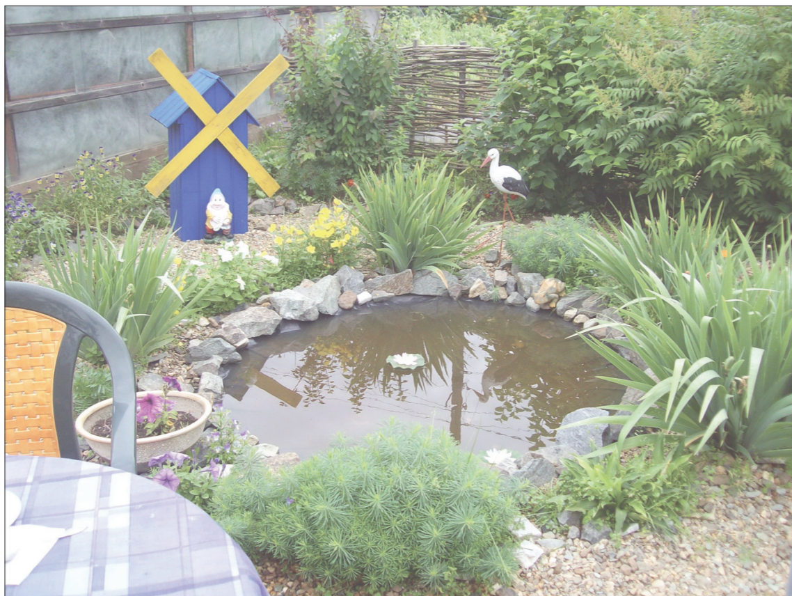
* Декоративный прудик.