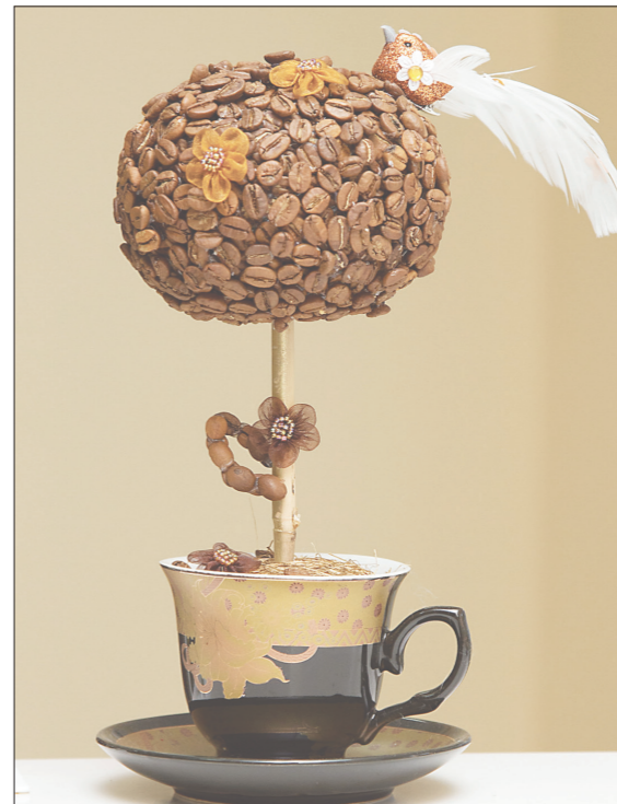
* Сувенир из кофейных зерен.