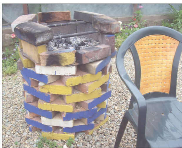
* Печка для барбекоу.