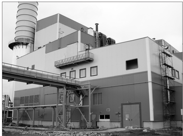
Энергоблок ООО «Уральская энергетика»

В понедельник, 25 июля, на Среднеуральской ГРЭС состоялся запуск энергоблока ПГУ-410 с уникальной газовой турбиной четвертого поколения. В церемонии открытия приняли участие председатель правительства РФ Владимир Путин и губернатор Свердловской области Александр Мишарин.