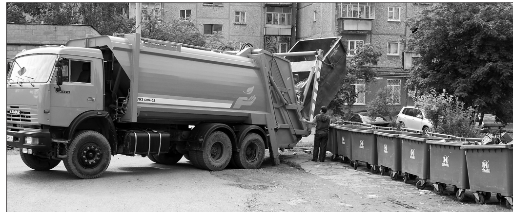
На контейнерной стоянке по улице Аганичева, 10, работает новый мусоровоз Тагилспецтранса.

Лицензия №07-54-000-878(66) от 25.02.2007г., выданная Федеральной службой по экологическому и атомному надзору. Рекламы.