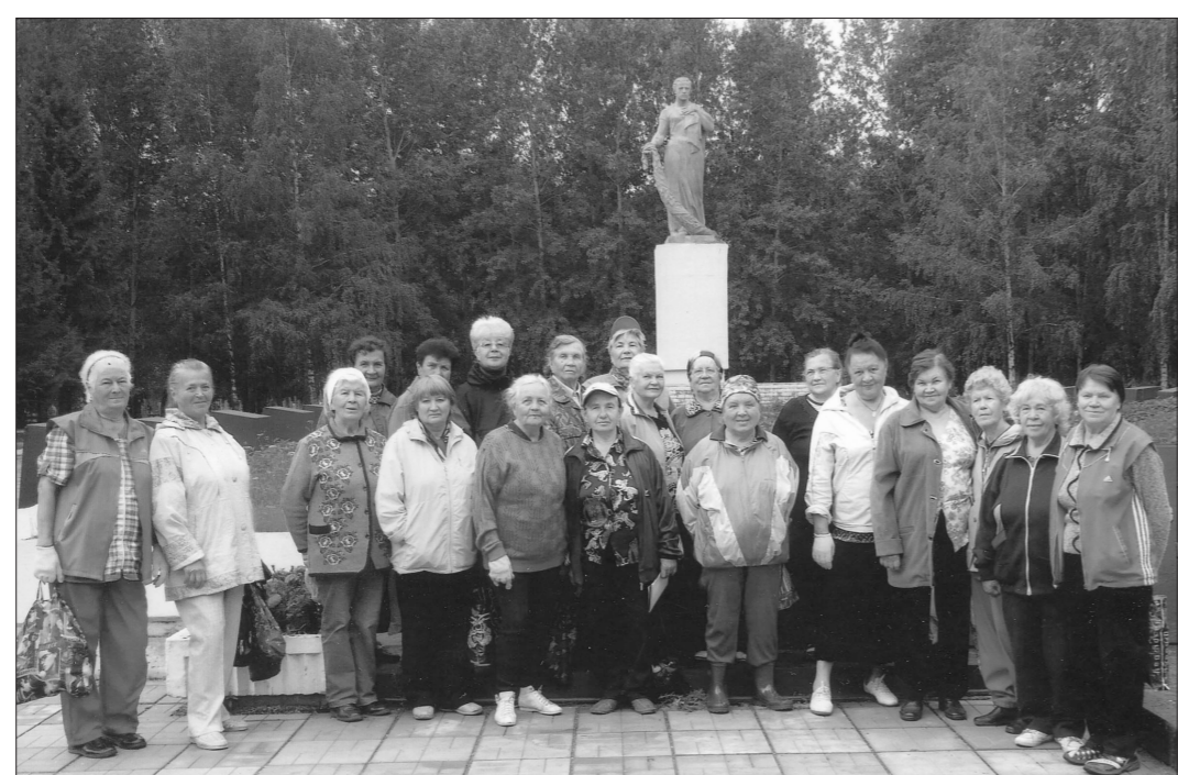
* Участники объединения «Дети войны» на мемориале кладбища «Центральное»

Приходила навестить могилу отца, видела, что не