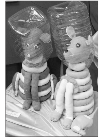
* Знаменитые собаки Белка и Стрелка.