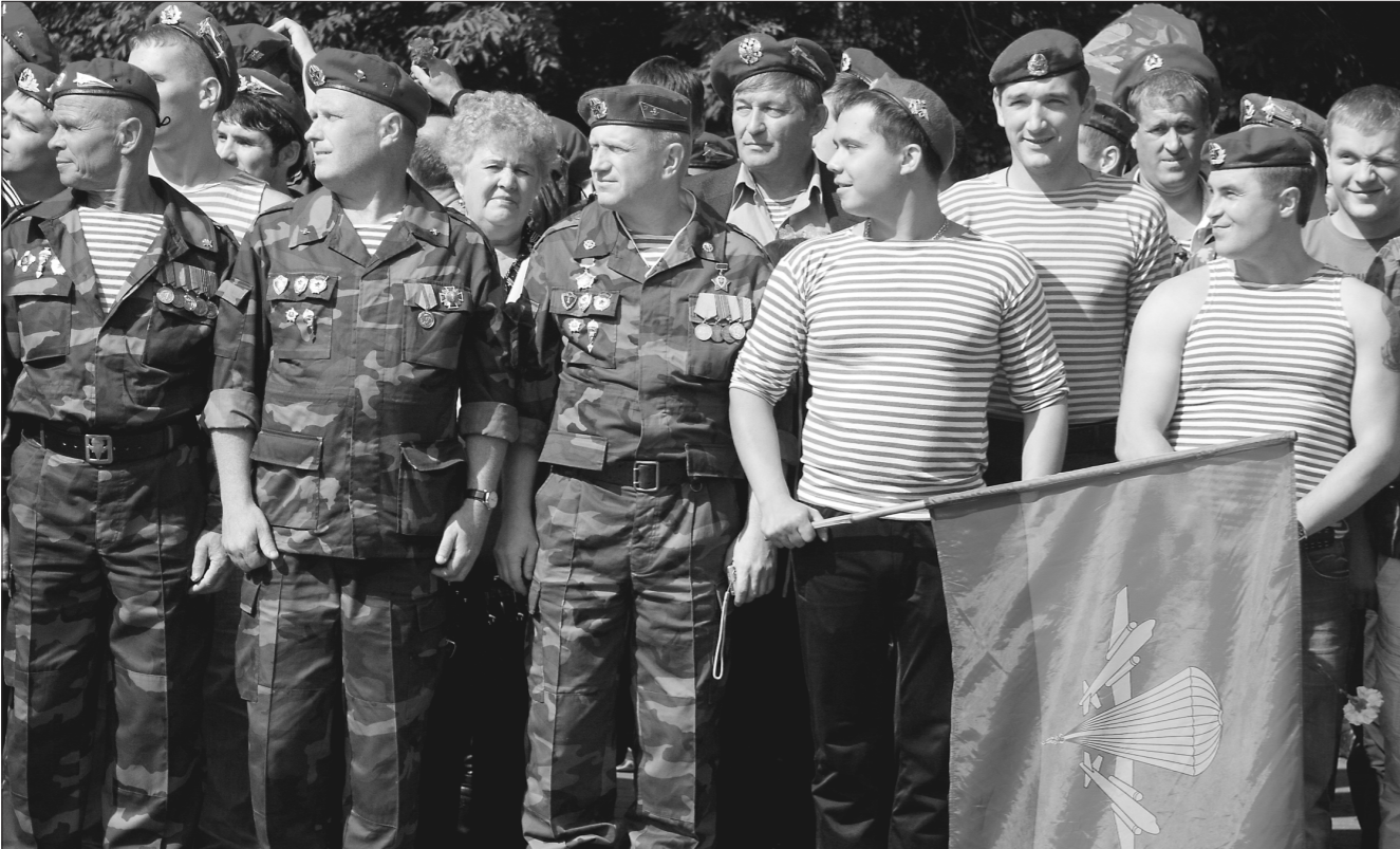
* Участники митинга.