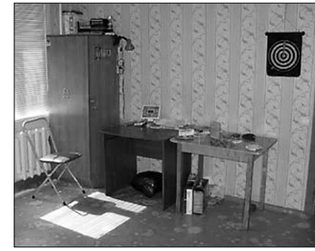
*Квартира, в которой было совершено убийство.

Следствие считает основным мотивом убийства семьи в Туле корыстные побуждения. Об этом 4 августа сообщается на сайте СК РФ.