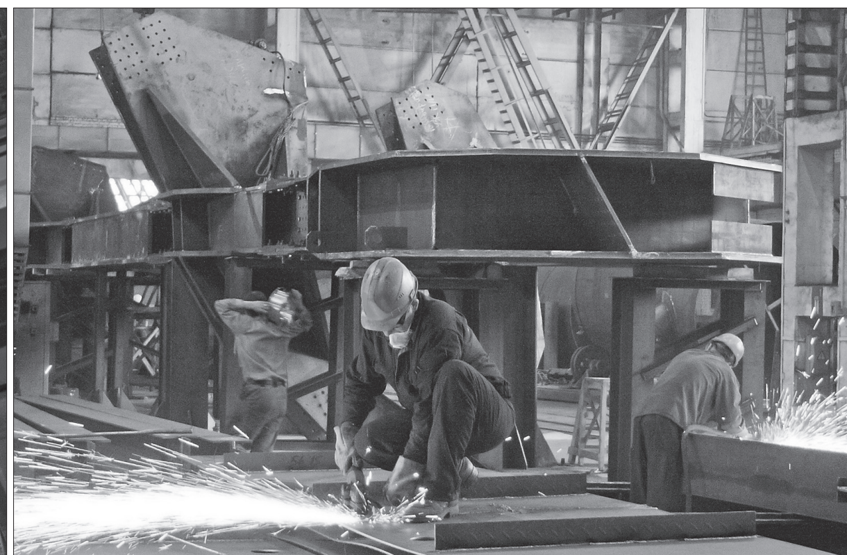
Идет контрольная сборка металлоконструкций.