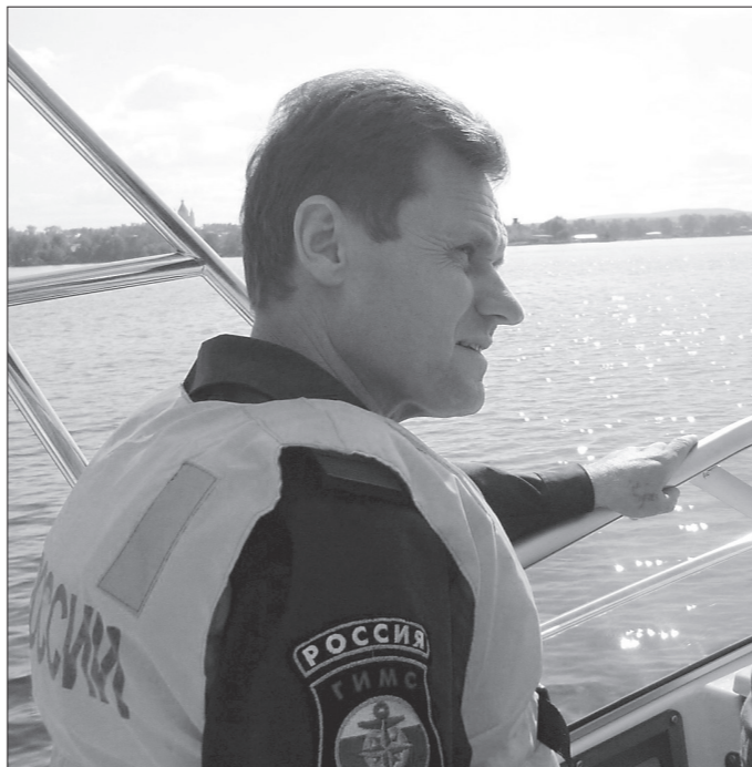
* Сергей Богдашин. Фото автора.