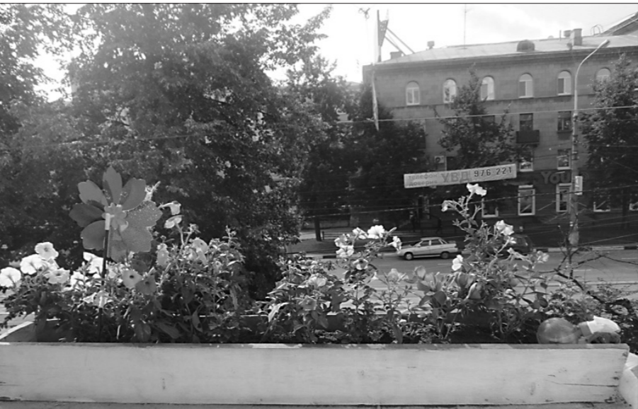
* Балкон О.И. Субботиной. Вид на улицу.