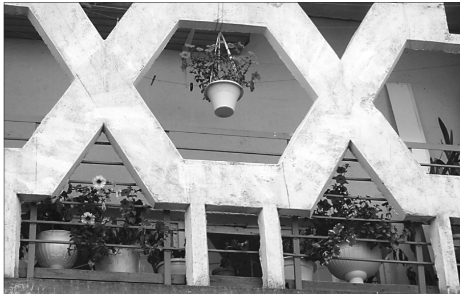
* Украшенный цветами хозяйлок в доме 2а по ул. Зари.