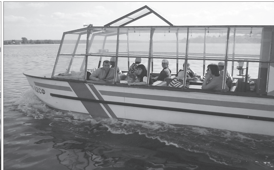
* Прогулочная лодка.

В связи с крушением теплохода «Булгария» к безопасности на воде стали относиться с повышенным вниманием. Соблюдают ли тагильские мореходы меры безопасности? Допускают ли перегруз пассажиров?