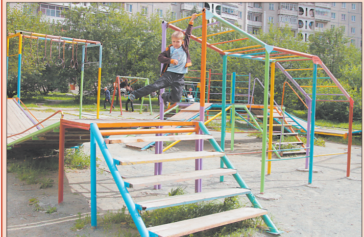
* Детская площадка у дома №107 на ул. Зари.

обошлось без крупных финансовых вложений (это, впрочем, не предусматривалось и по условиям конкурса), главное, что преображение дома и подъезда произошло по доброй воле самих собственников. По моему глубокому убеждению, этот прекрасный опыт достоин распространения. У входа обустроены клумбы, благодаря которым фасад заиграл яркими, веселыми красками. В мебелированном холле (здесь даже есть пианино!) масса декоративной зелени, цветов, размещены стенды с полезной информацией для собственников, работает консьерж (к слову, на Вагонке всего два таких дома, и оба находятся на управлении в УК