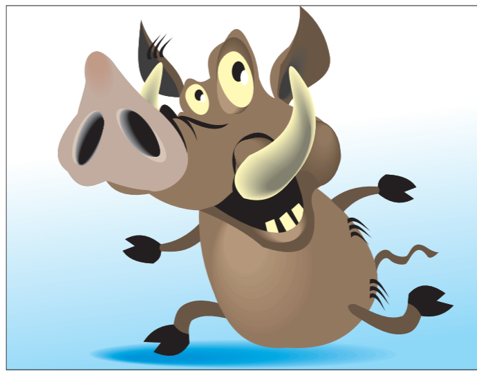
Иллюстрация Петра УПОРОВА.

Дикий кабан вплавь самостоятельно добрался до Саратова. Животное приплыло на набережную Космонавтов, но выбраться на берег не сумело, так как сушу и воду разделяет высокое бетонное ограждение.