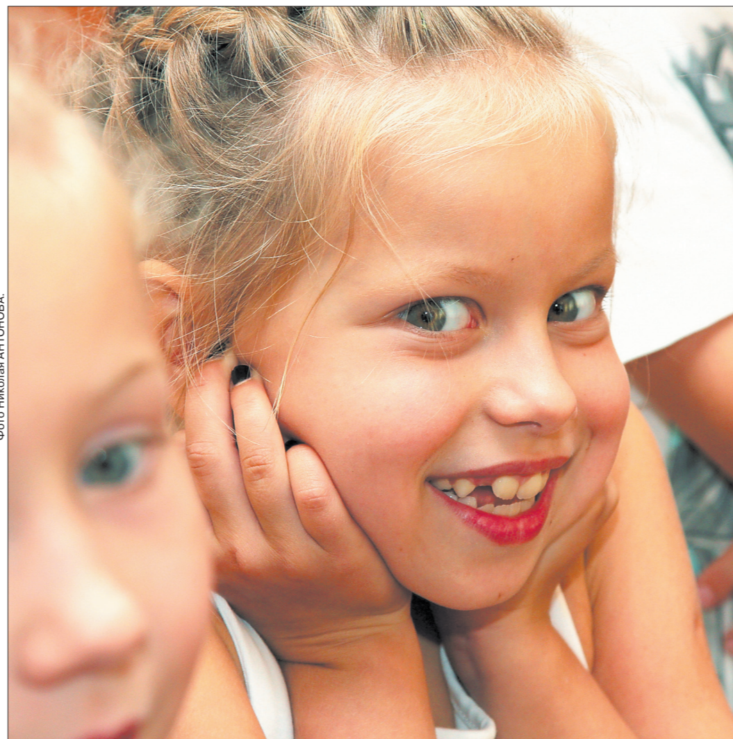
* Теперь малыши знают, как беречь свои ушки.