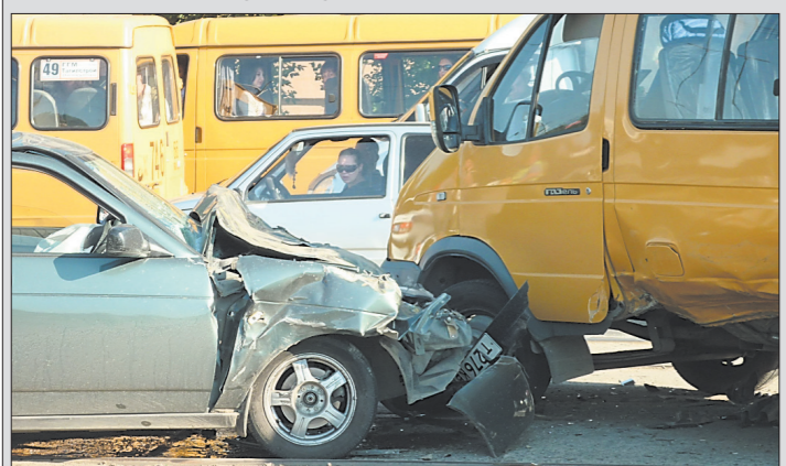
* Авария возле «Современника».

Корреспонденту «ТР» удалось сфотографировать послед-