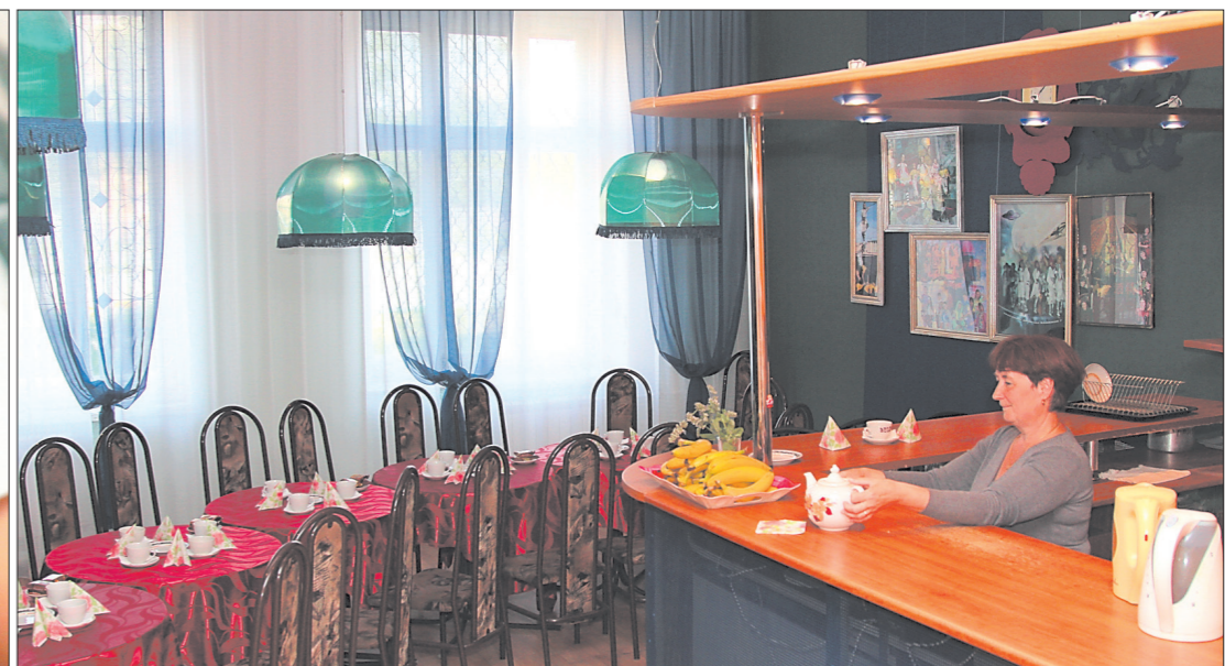
* Летнее фитокафе ждет юных посетителей.