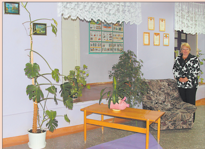
* В подъезде дома №71 по пр. Дзержинского.