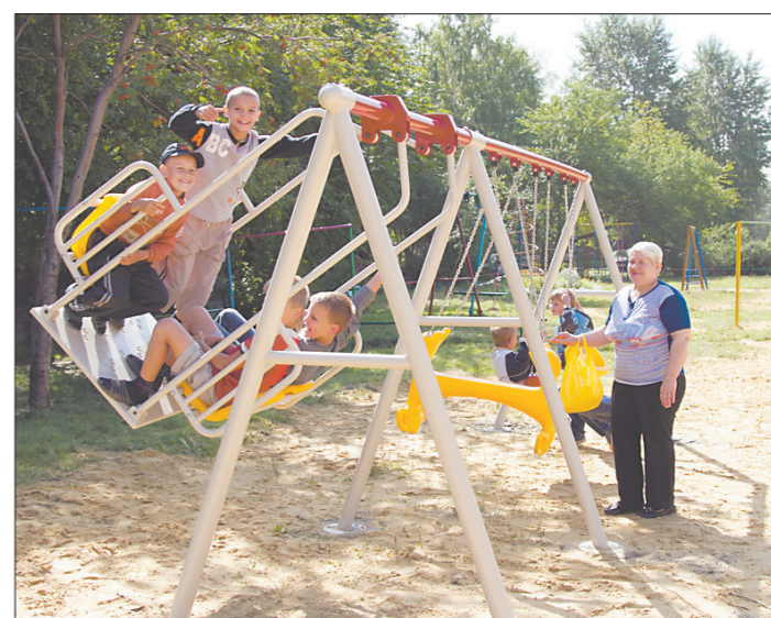
* Детские площадки, оборудованные УК «ТС»: ул. Попова, 14...