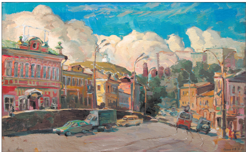
* И. Гунина. «Улица Александровская».

Вечер - это не время суток, а настроение, особое состояние души. Так решили сотрудники музея изобразительных искусств и выбрали для традиционной выставки к Дню города тему «Тагил вечерний».