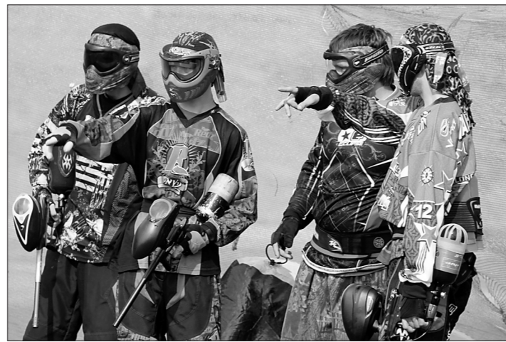
Перед боем команда разрабатывает схему атаки.

Среди профи первенствовала команда СТК «Прайт» из