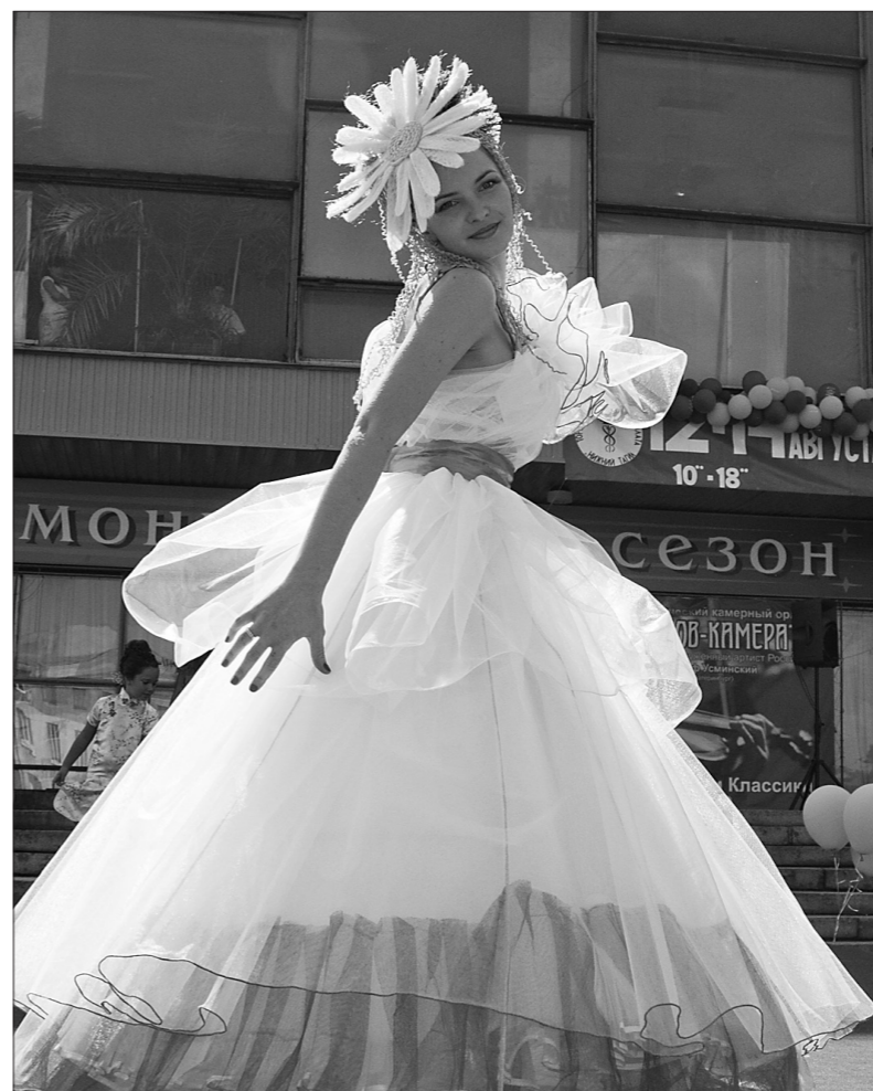
* Так, по мнению стилистов, выглядит девушка-лето.