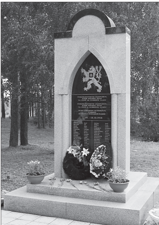
* Мемориал чешским legionерам.