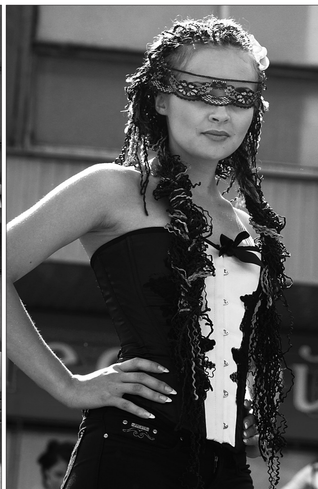
* Креативная модель.