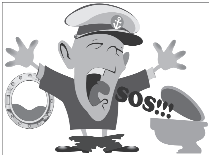
Иллюстрация Петра УПОРОВА.