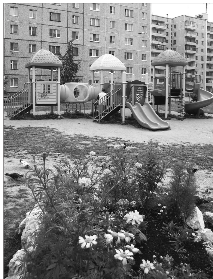
* Двор у дома №5 по улице Захарова сегодня один из лучших в городе.