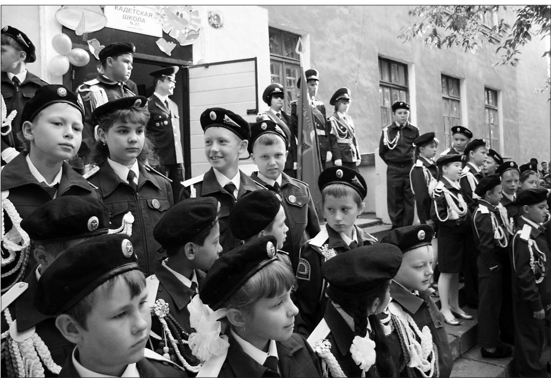
Школьный хор скоро запоет.