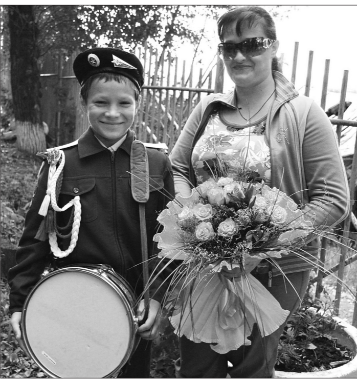
Юный барабанщик вместе с мамой.