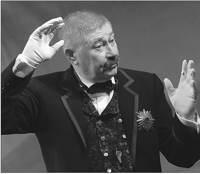
* Народный артист России Юрий Цапник - Гаэтано Семмолоне, богатый человек, но не аристократ.