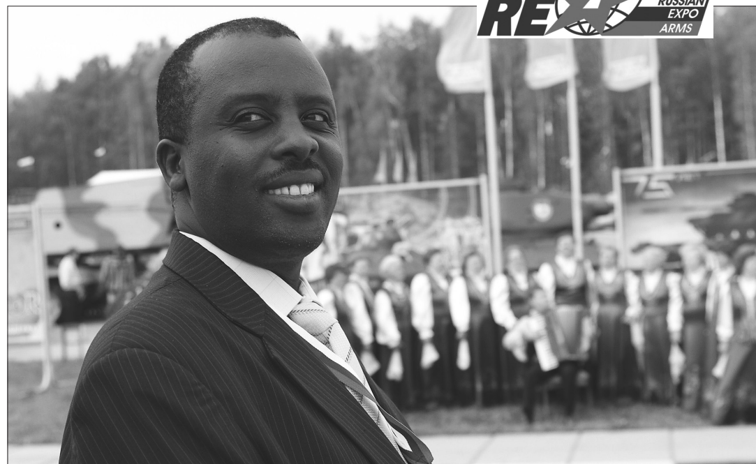
Окончание. Начало на 1-й и 2-й стр.)

Москва подготовили показательные выступления снайперов, челябинцы познакомились с методиками управления индивидуальным и групповым боевым стрельковым оружием.