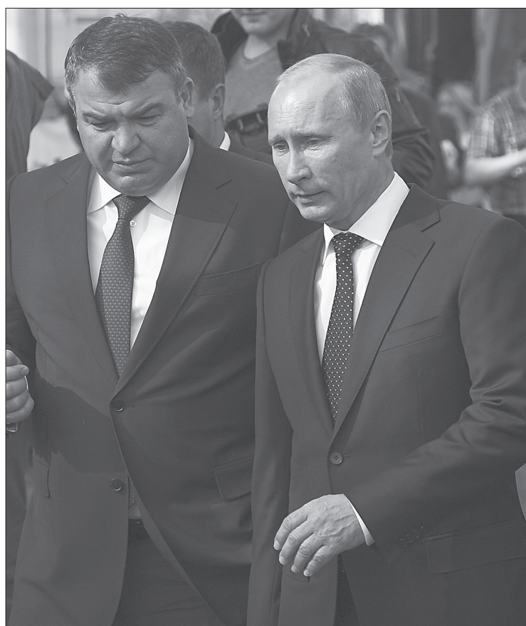
* Председатель правительства РФ Владимир Путин и министр обороны России Анатолий Сердюков (слева) во время посещения выставки.