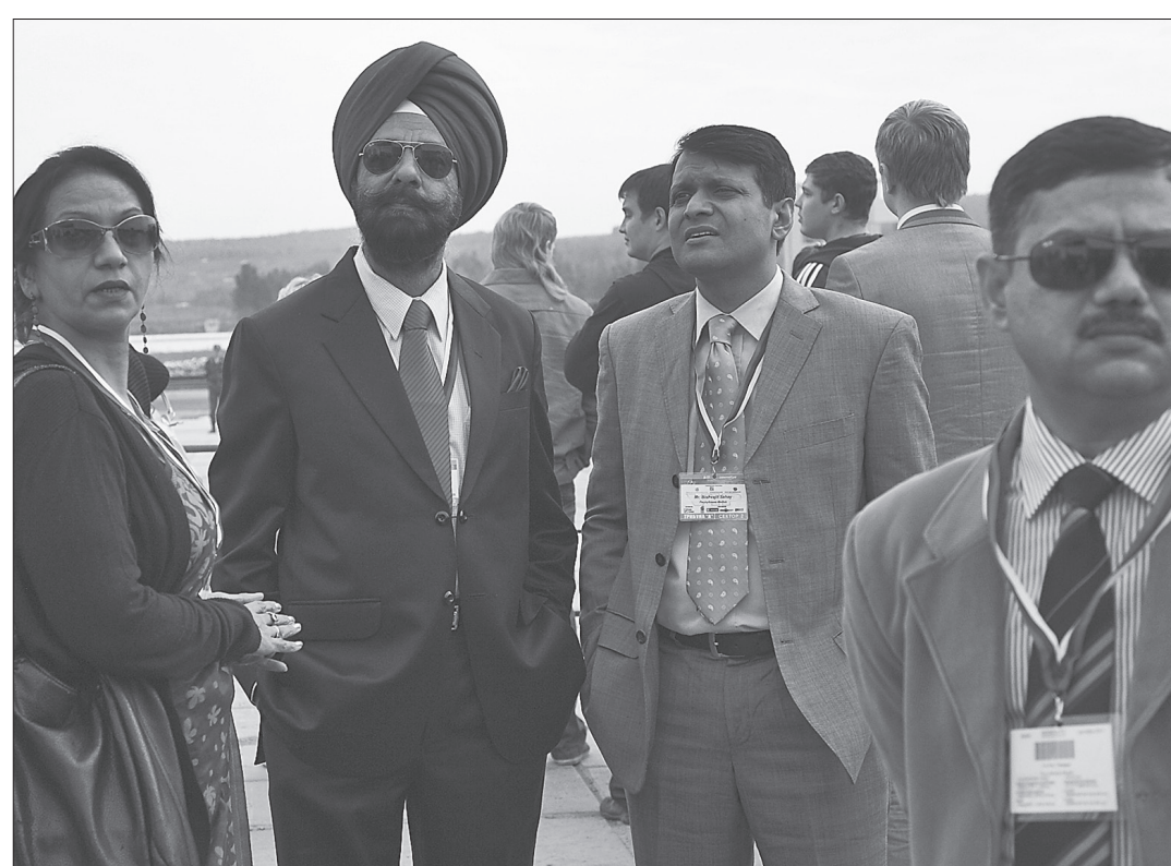
* Гости из Индии внимательно наблюдали за авиашоу.

Организаторы заявили о том, что выставка превзошла все ожидания. С приветствием к участникам обратился президент России Дмитрий Медведев. Лично познакомился с работой выставки и образцами военной техники премьер-министр Владимир Путин. Принято решение о создании федерального центра испытаний и демонстрации военной техники и вооружения на базе демонстрационно-выставочного центра в Нижнем Тагиле, а это означает выход на каче-