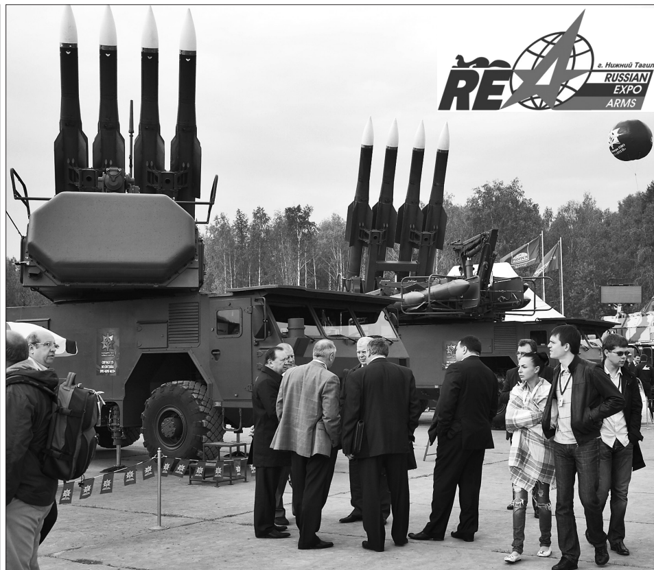
* Зенитно-ракетные комплексы «БУК».