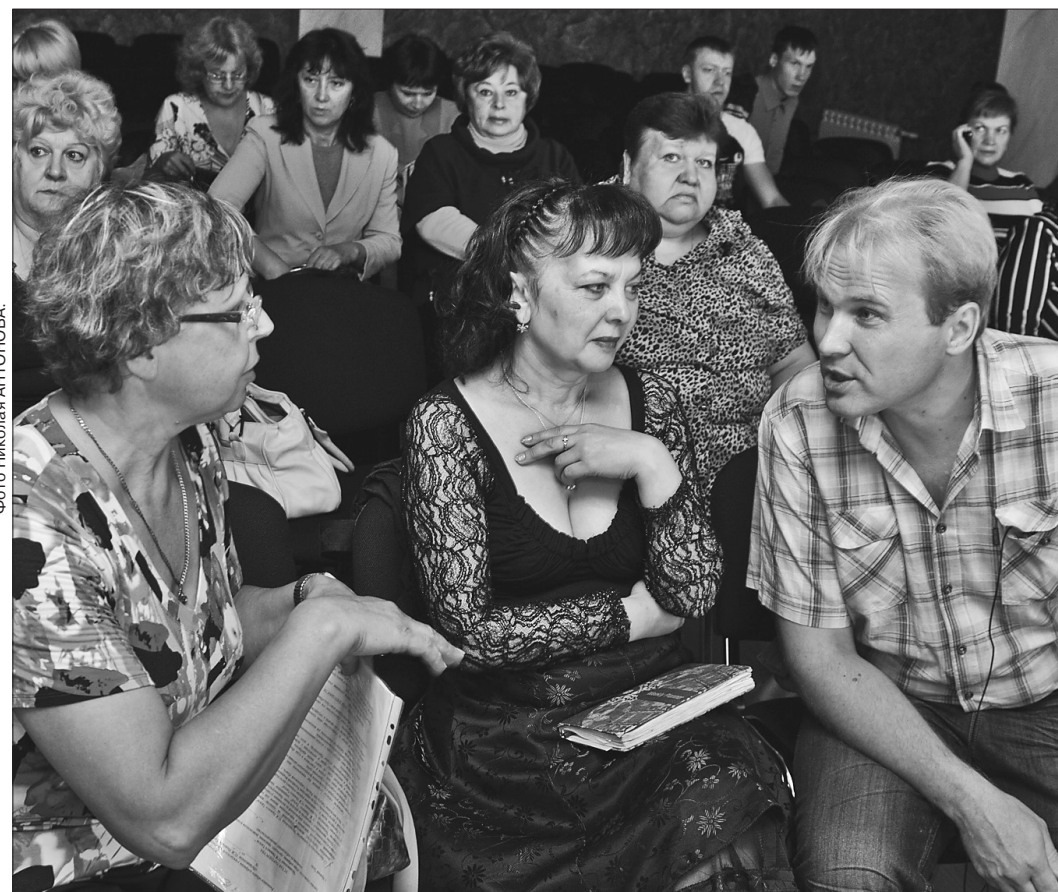
* Участники семинара обсуждают насущные проблемы ЖКК.

Нововведения в Жилищный кодекс РФ, вступившие в силу в этом году обсудили на семинаре в рамках партпроекта «Единой России» «Управдом». На очередном обучающем занятии, прошедшем недавно в общественно-политическом центре, присутствовали председатели ТСЖ, руководители управляющих компаний, представители Роскоммунэнерго и УВЗ.