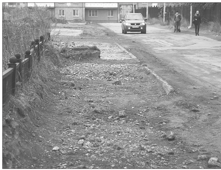
Здесь будет тротуар.