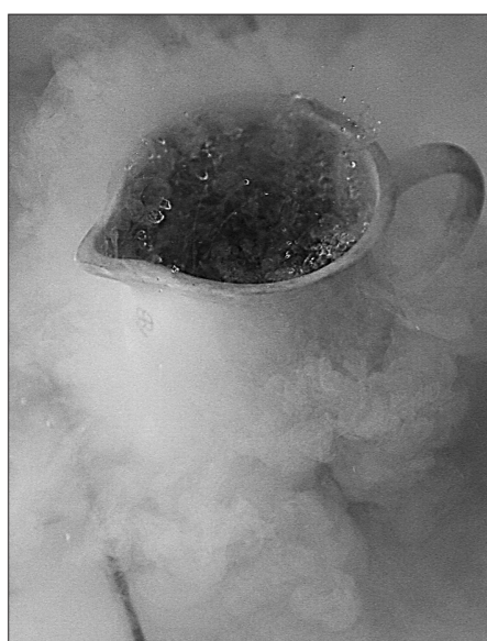
* «Кипение» жидкого кислорода.