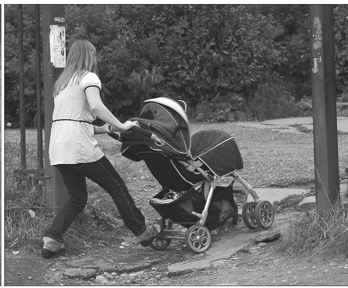
Мамы с колясками добираются до поликлиники в обход, через дворы, где движение также далеко не комфортное.

На днях началось строительство тротуара на улице Тагилстроевской, о необходимости которого более десяти лет твердили жители ГТМ и писала наша газета.