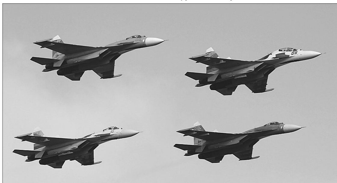
* В небе Су-27.

Не было отбоя от желающих проверить на себе цепкость «лап» роботов и у