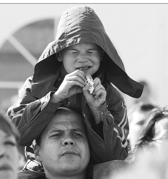
* Сейчас как бабахнет...

Отношение организаторов и участников выставки к посетителям было настолько доброжелательное, что некоторые даже почувствовали себя хозяевами на этом празднике жизни. Да, можно было купить пиво в летних кафе. Да, не запрещалось разгуливать с бутылками и пластиковыми стаканчиками по площадкам и павильонам. Но некоторым и того показалось