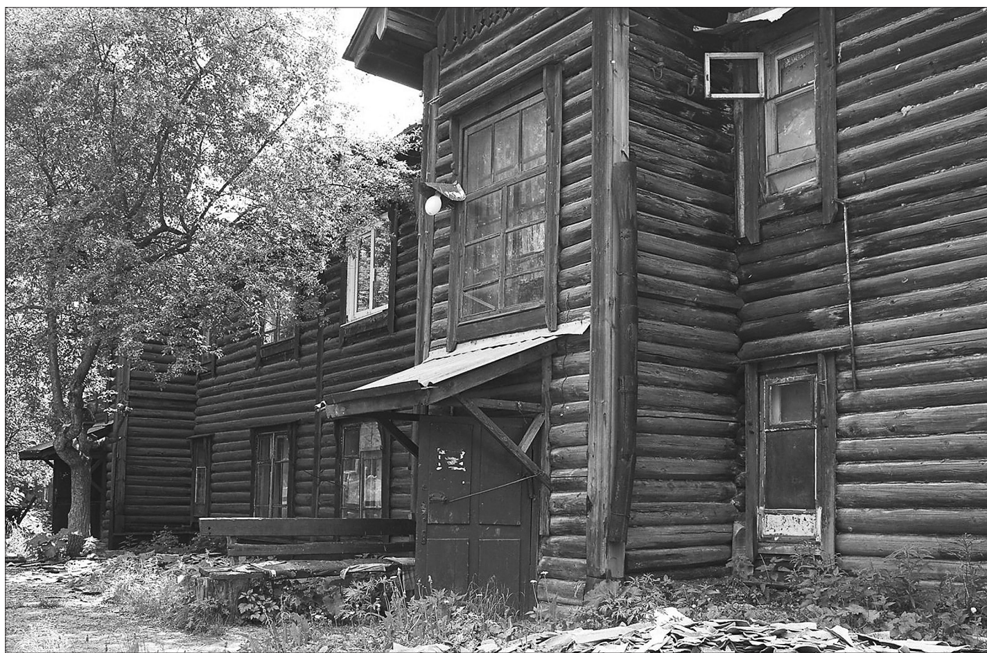
Дом №43 по улице Красногвардейской.