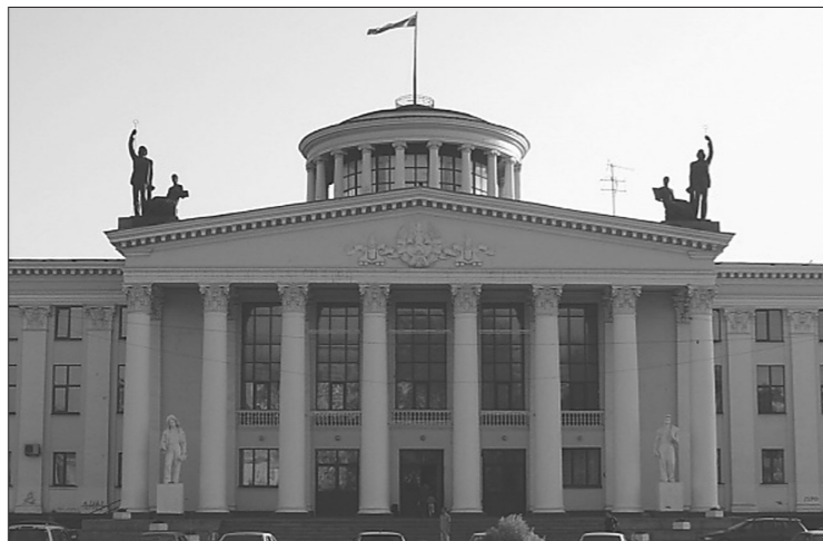
* Дворец культуры НТМК.