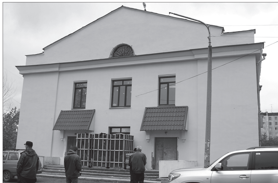
* Так теперь выглядит фасад санпропускника.

администрации города, медики, журналисты. Еще у входа в здание прибывших встретил недавно назначенный на должность директора муниципального казенного предприятия