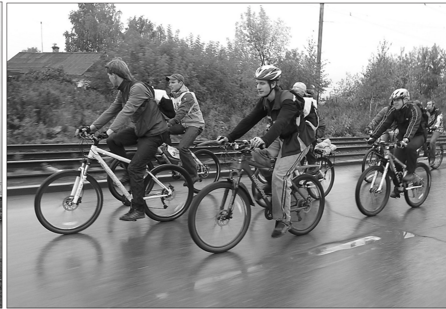
На велосипедах – под дождем.

Первый в городе велопробег в поддержку создания велосипедных дорожек прошел не так давно в Нижнем Тагиле.