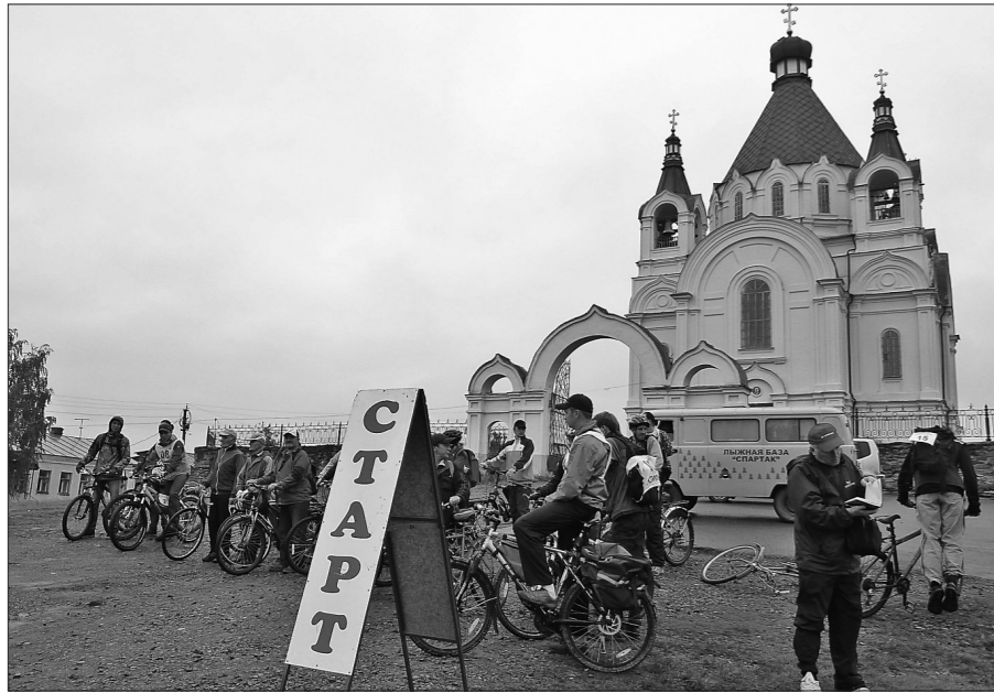
Фото участников велопробега.