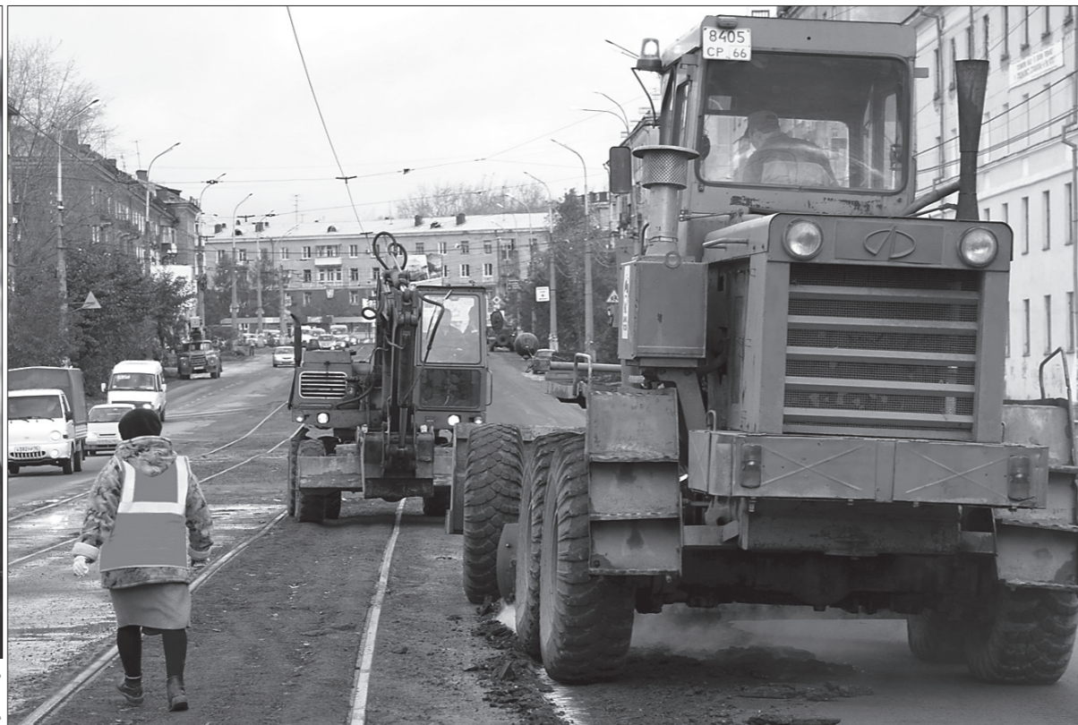
* Ремонт дороги на пр. Мира.