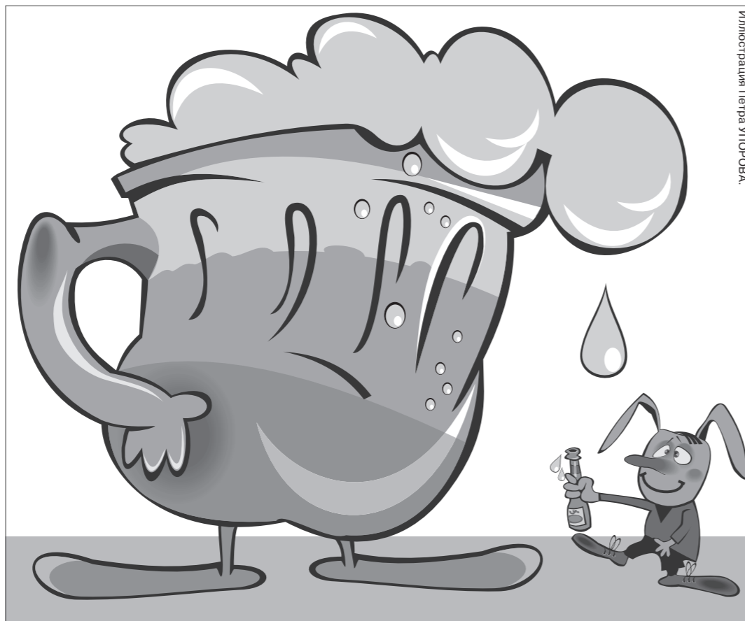
Иллюстрация Петра Угрюмова

А что, разве меньше стало молодых женщин, идущих с коляской и бутылкой пива или сигаретой во рту? Недавно видела на остановке маршрутного такси такую