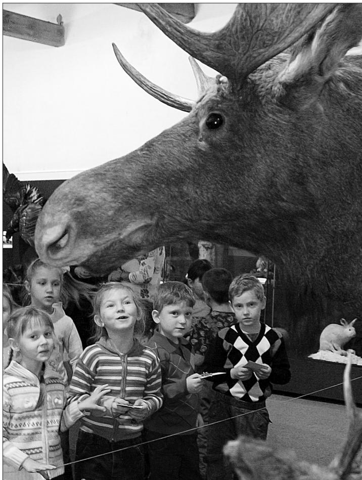
* Детсадовцы в музее природы.

Сегодня в музее природы - семейный праздник, посвященный недавно прошедшему Всемирному дню защиты животных. В течение дня здесь ждут юных тагильчан и их родителей, готовых и рассказ про Красную книгу послушать, и принять участие в многочисленных играх.