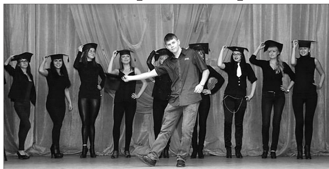
* Немецкий танец в исполнении немецко-английского ансамбля.

В институте филологии и массовых коммуникаций НТГСПА прошло празднование Международного дня иностранных языков.