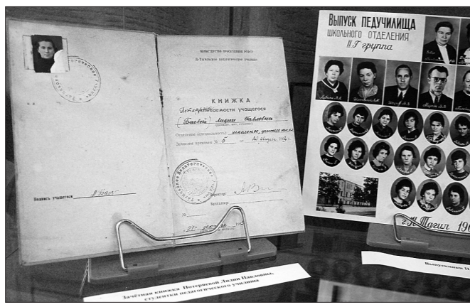
* Фрагмент выставки «Кладовая знаний».