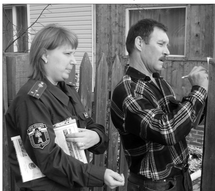
* Инспекторы обучают жильцов на улице Весенней.

Дверь к злополучным соседям была открыта настежь, жильцы не отвязались, но заходить туда не хотелось из-за резкого и неприятного затхло запаха. Таких квартир здесь хватает в каждом доме. Но среди