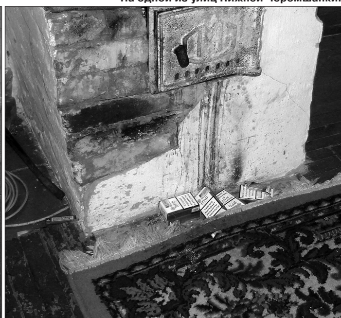
* К этой печи было много претензий.

мятки жильцам розданы, однако тягостный осадок от посещения этих мест остался: ребенок, гуляющий в одних голяках по лужам, черные деревянные бараки, горы мусора и стаи бродячих псов... От созерцания такой картины становится не по себе.