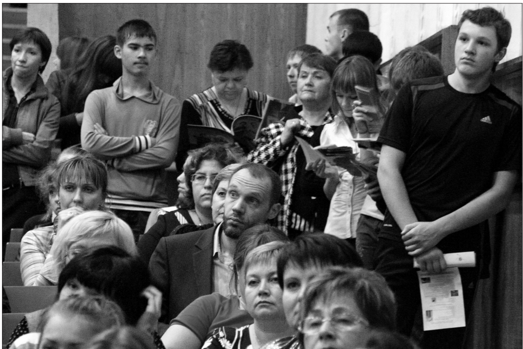
* Участники встречи.