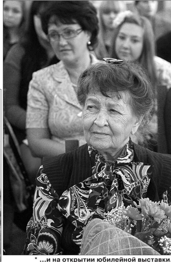
* ...и на открытии юбилейной выставки.

В 1924 году Нижнетагильский окрисполком впервые поставил вопрос об открытии в городе педагогического техникума. И уже 1 октября 1926 года педтехникум распахнул двери для успешно прошедших испытания по русскому языку, обществу, математике, физике.