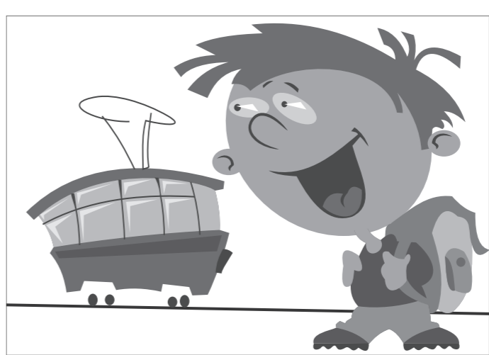
Иллюстрация Петра Митусова