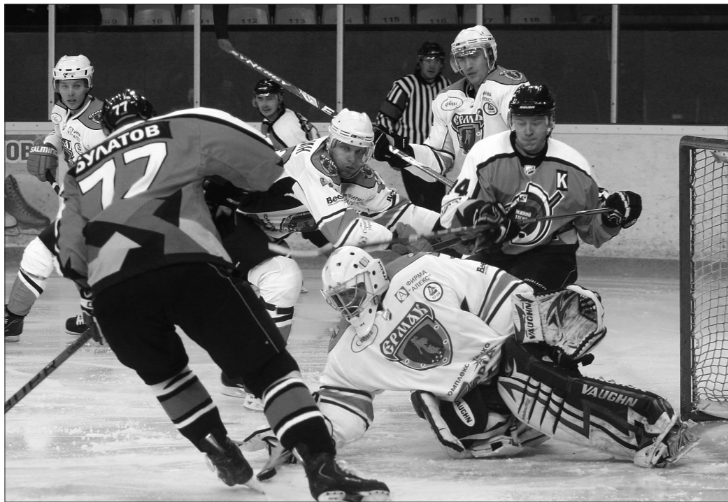
* Первое звено «Спутника» ведет осаду ворот «Ермака».

«Спутник» одержал победу со счетом 3:2 над ангарским «Ермаком». Соперники выступили в форме одинаковой цветовой гаммы, так что встречу вполне можно назвать дерби оранжево-белых.