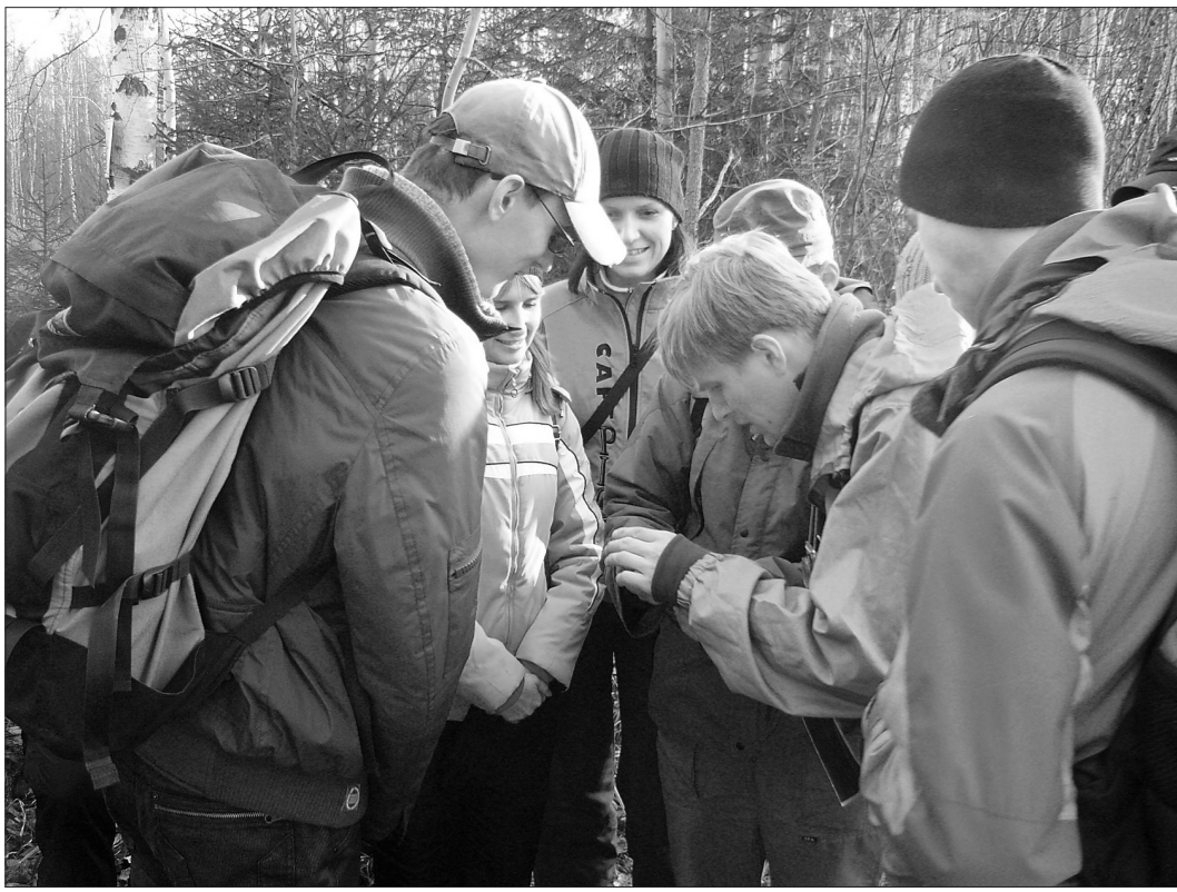
* Ориентировались по карте и компасу.