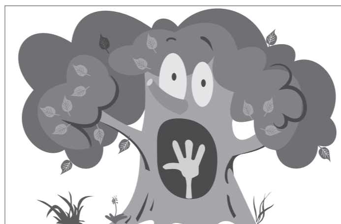
«Я понятия не имею, почему он оказался в дереве», - отметил представитель управления шерифа округа, комментируя ситуацию. Лента.Ру.

К застрявшему спасательная группа из пожарных прибыла после того, как местные жители сообщили в экстренную службу о том, что слышали из лесистой местности крики о помощи. Вскоре после этого мужчина обнаружил - он находился в дупле, которое расположено ближе к нижней части ствола дерева. Большая часть туловища американца ушла в дупло, на поверхности были лишь голова, грудь и руки. С помощью специального оборудования пожарные спилили часть дерева, что позволило жителю округа Ориндж вырваться из ствола.