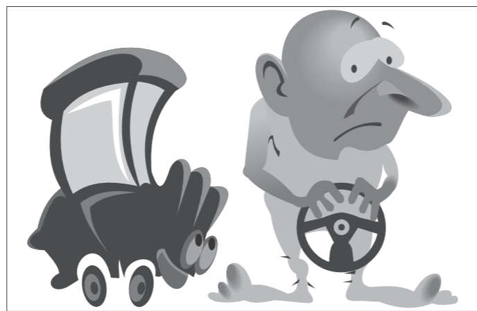
Иллюстрация Петра УПОРОВА.

Пригласил как-то мужик своего друга домой. Оба пьяны. Знакомит он друга с квартирой: