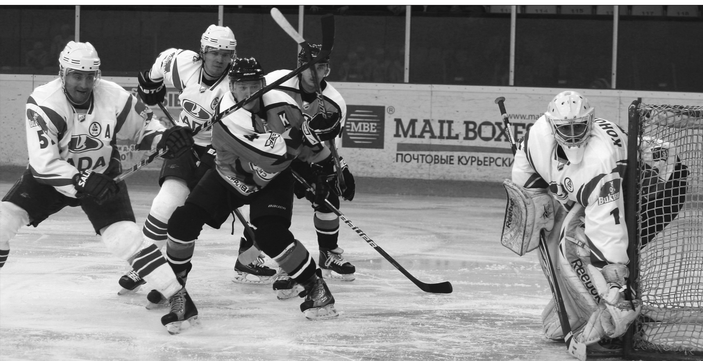
* В атаке первое звено «Спутника».