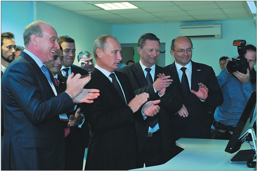
* В.В.Путин открыл цех колесных пар.