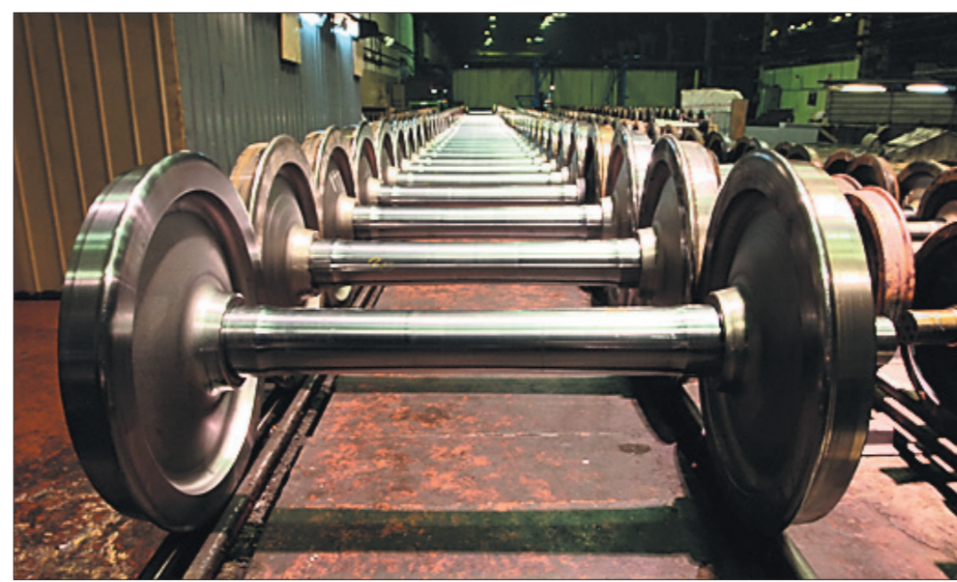
* Цех колесных пар УВЗ.

встроенной системой контроля, установку для замера оси, автоматизированные прессы для запрессовки колес на оси, измерительную