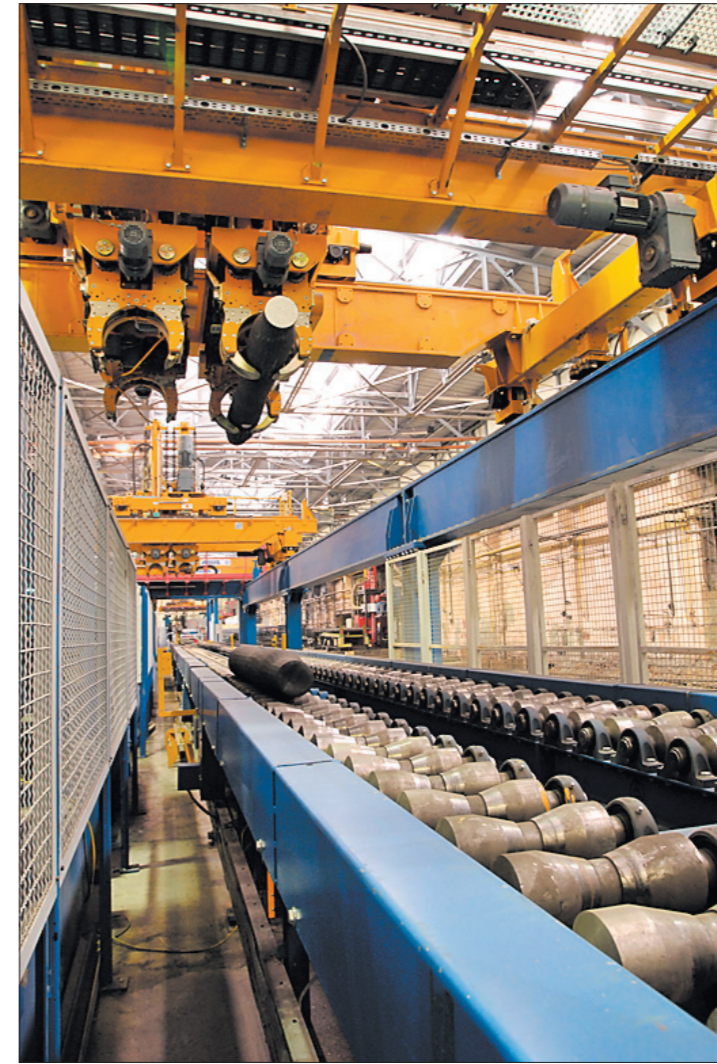
* Современная линия по обработке черновых осей.

Игорь БАЗИЛЕВИЧ: Я уже говорил про культуру производства, которая зависит, в первую очередь, от порядка на рабочих местах, от того, насколько грамотно, без излишних временных затрат построена производственная цепочка. Всего