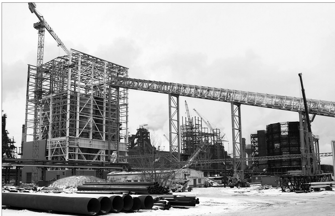
* Строительство склада угля на коксохиме.

В доменном цехе Нижнетагильского металлургического комбината завершен монтаж механической части валковой мельницы французской фирмы Loesche. Это основной агрегат пылеподготовительного отделения цеха, строящегося в рамках реализации проекта по переводу доменных печей на пылеугольное топливо. Производительность мельницы составит 88 тонн топлива в час.