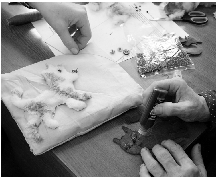
* Создание страницы для тактильной книги «Кто сказал «мяу»?»

Дело в том, что для изготовления тактильной литературы недостаточно материалов и желания, нужно знать о том, из каких тканей можно шить страницы, почему под запретом фольга