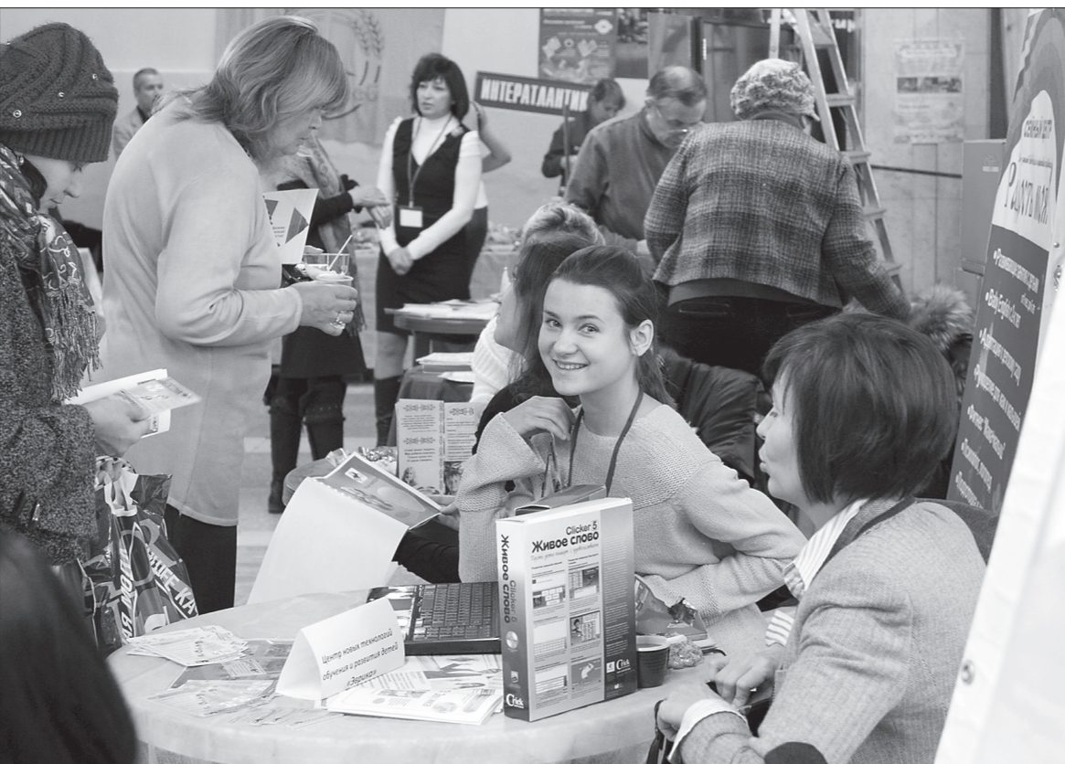
* Участники выставки.

В рамках VII специализированной выставки-ярмарки «Предприниматели – родному городу» в городском Дворце детского и юношеского творчества прошла пресс-конференция, посвященная проблемам малого и среднего бизнеса в Нижнем Тагиле. Участники встречи подвели итоги работы в сфере предпринимательства.