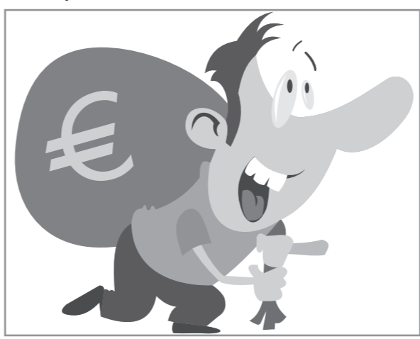
Иллюстрация Петра УПОРОВА.

Итальянский рабочий выиграл в лотерею 1,7 миллиона евро, сообщает ANSA. Выигрышный билет был приобретен жителем коммуны Лонгаре, расположенной в регионе Венето, в 11 часов утра 11 ноября 2011 года.