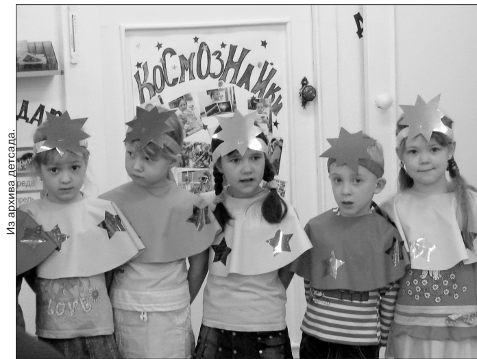
* Звездочки из команды «Космознайки».

На днях стало известно, что первое место в интеллектуально-творческой игре «ЭкоКолобок», посвященной 50-летию полета в космос Юрия Гагарина, на 11-м областном фестивале «Юные интеллектуалы Урала» среди дошкольных образовательных учреждений присуждено детскому саду №133 комбинированного вида (Тагилстресковский район).