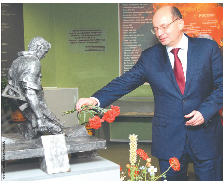
* Александр Мишарин возлагает живые цветы к макету памятника тагильчанам, погибшим в горячих точках планеты.

Визит в Нижний Тагил губернатора Свердловской области Александра Мишарина 18 ноября начался с посещения музея памяти воинов-интернационалистов, погибших в локальных войнах планеты.