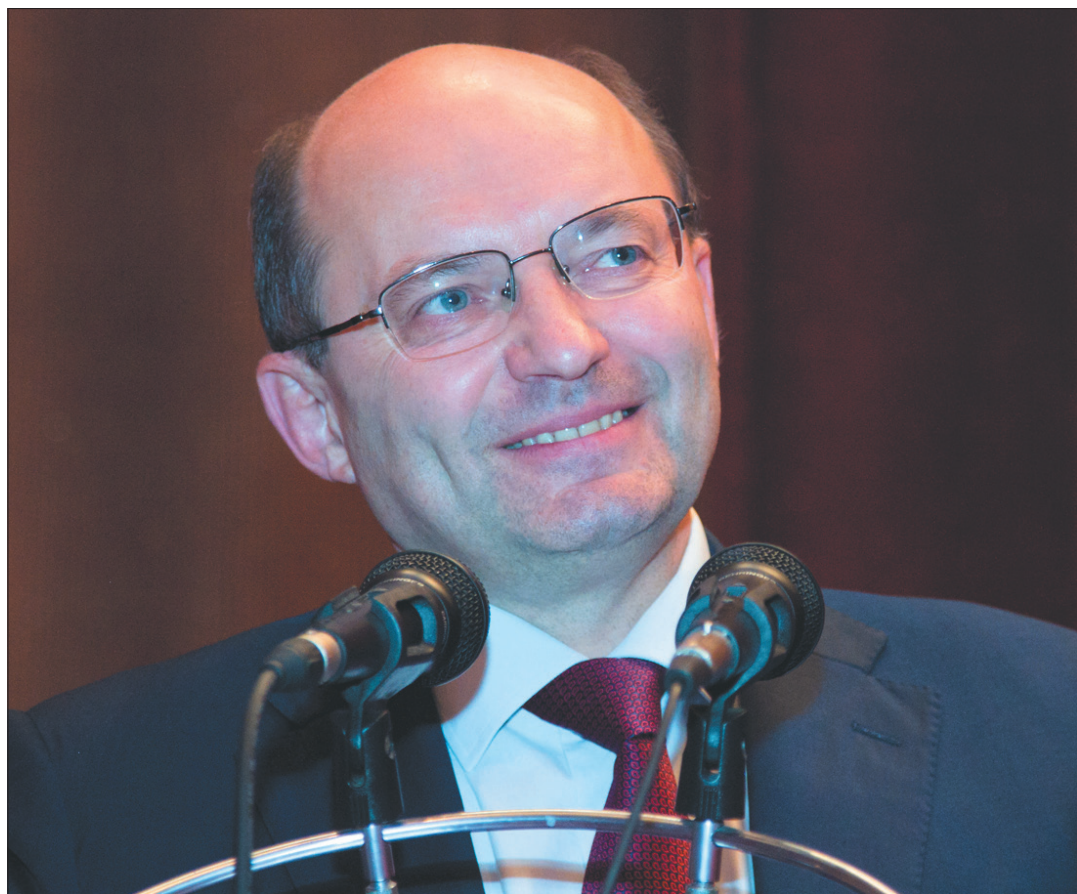
* Александр Мишарин на встрече с представителями бюджетной сферы.

Разговор о серьезных вопросах, которые беспокоят людей, продолжался в течение двух часов. Губернатор рассказал о том, как пришлось столкнуться с экономическим кризисом и сопутствующими ему реалиями, а затем - выходом из тяжелого для страны и Свердловской области периода.