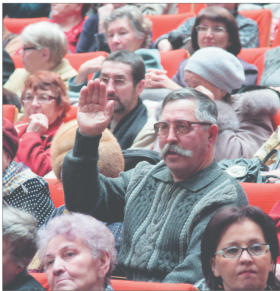
* Участники встречи задали много вопросов.