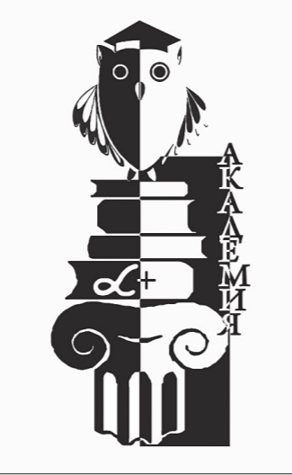
* Эмблема проекта.

В гимназии №86 появился новый повод для гордости – уникальный учебный проект «Академия «Альфа плюс». Пока он объединяет около сотни гимназистов и их педагогов, но со временем его участниками смогут стать и учащиеся других школ Нижнего Тагила.