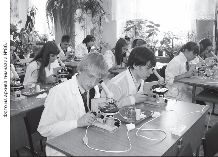
* Первые предметные погружения «академиков».