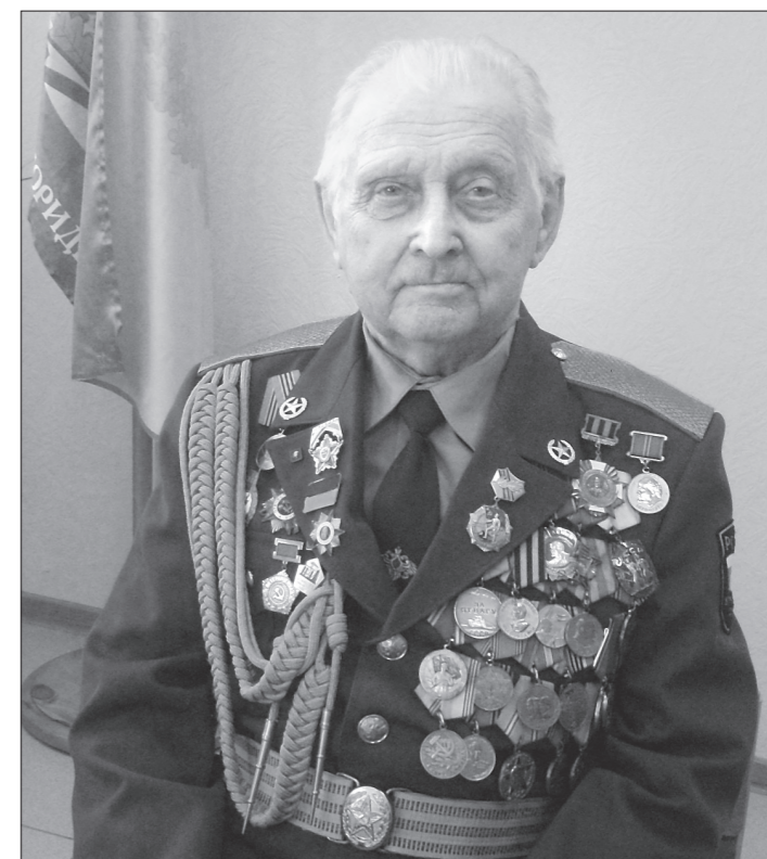
Фото автора. * Александр Васильевич Федин.