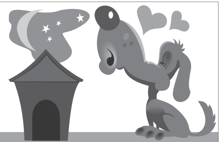
Иллюстрация Петра УПОРОВА.

В то же время в Росалкогольрегулировании исключили ситуацию, при которой разные нормы будут распространяться на разных участников рынка. В агентстве заявляют, что их позиция подтвердил суд. Всего сейчас в России 25 крупных операторов магазинов duty free. Общий оборот трех крупнейших компаний рынка составляет около миллиарда долларов, сообщает Лента.Ру