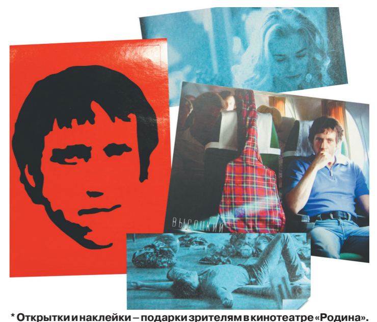
Открытки и наклейки - подарки зрителям в кинотеатре «Родина».

Нынешний декабрь в России оказался месяцем сюрпризов. И, пожалуй, одним из главных сюрпризов для многих стала мощная раскрутка фильма режиссера Петра Буслова «Высоцкий. Спасибо, что живой».