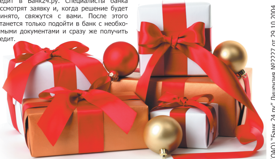
(ОАО) Банк 24.ру. Лицензия №2227 от 29.10.2004

Узнать информацию о кредитных бонусах, а также подать заявку на кредит можно в офисе Банка по адресу пр. Ленина 40 и по телефону: 495-724