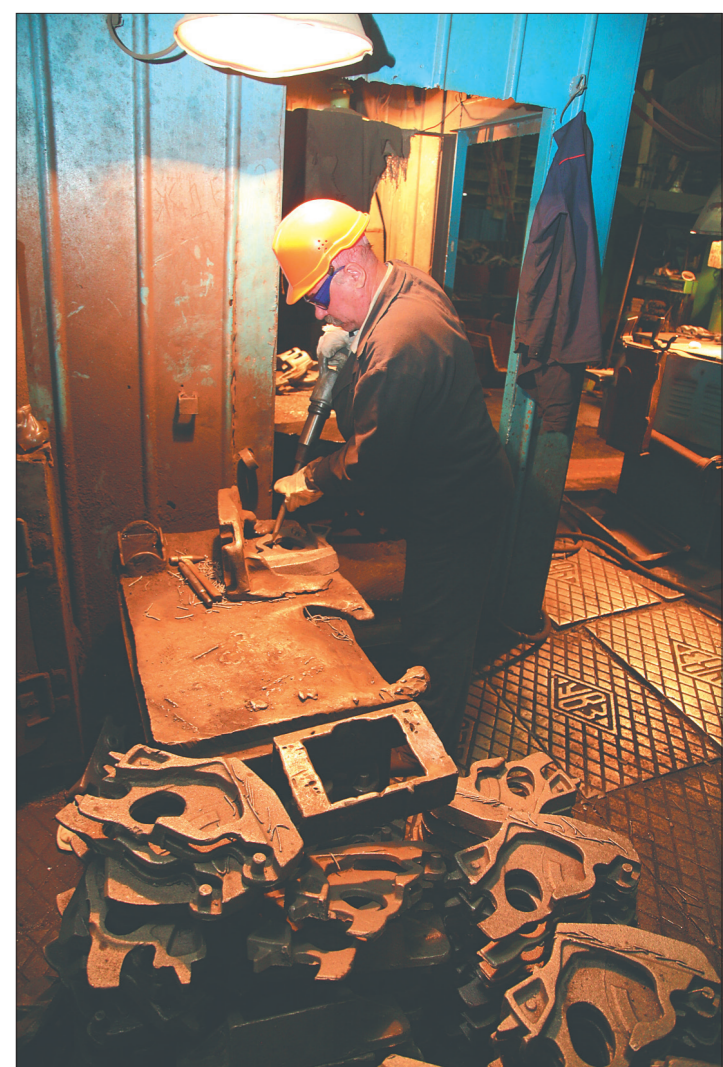
* Обрубщик в литейном цехе.